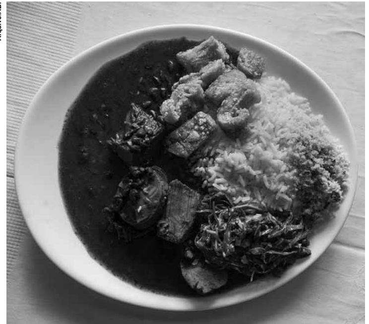
Embora alto, o valor calórico das refeições em fast foods foi inferior ao de de pratos feitos.

O estudo mediu as calorias de 223 amostras de pratos populares e de 111 refeições escolhidas aleatoriamente à la carte e