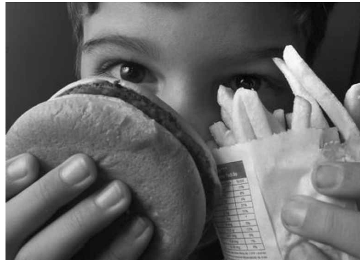
Se a porção de comida é excessiva, a recomendação é não comer tudo, dividir.