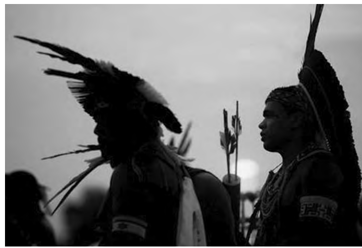
Atualmente existem 462 terras indígenas regularizadas em todo o país.

De acordo com a Fundação Nacional do Índio (Funai), atualmente existem 462 terras indígenas regularizadas em todo o país. Essas áreas totalizam mais de 1 milhão de km 2 (maior que a área do estado de Mato Grosso) e equivalem a de 12,2% do território nacional. Pouco mais de 50% das áreas estão localizadas na Amazônia Legal (54%). A Confederação da Agricultura e Pecuária do Brasil (CNA) defende que o