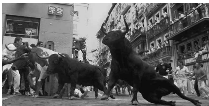
Esta última corrida foi descrita como perigosa pelos especialistas.

Ao menos 11 pessoas ficaram feridas durante a última corrida de touros do Festival de São Firmino, em Pamplona, no norte da Espanha, na sexta-feira (14). O evento atrai milhares de turistas de todo o mundo que percorrem 875 metros. A corrida desta sexta durou 2 minutos e 10 segundos e incluiu touros da raça Miura, que tradicionalmente encerram o evento.