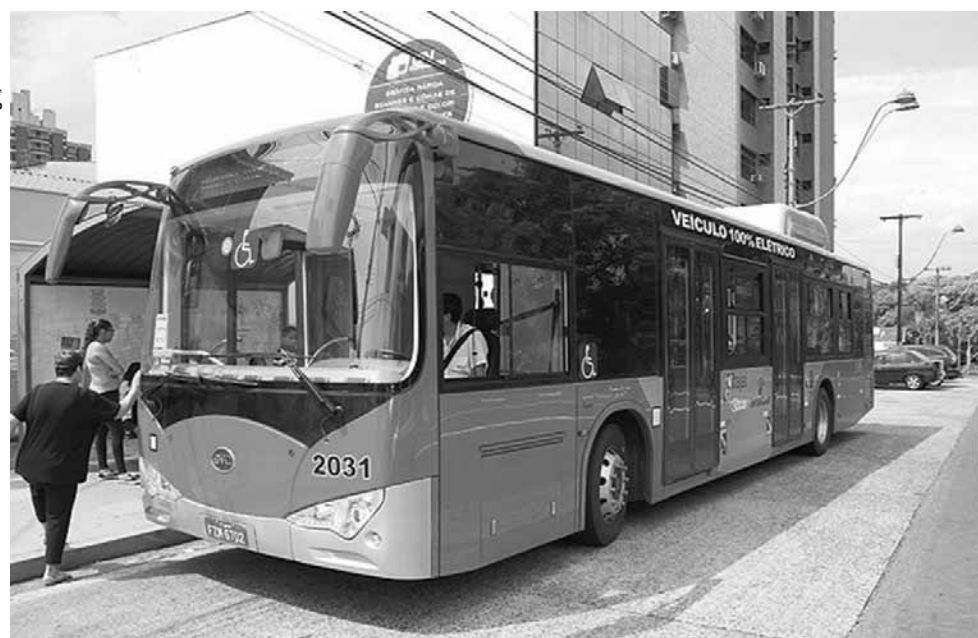
O ônibus tem motores elétricos embutidos nas rodas e sistemas auxiliares hidráulicos e pneumáticos.

Segundo o prefeito de São Paulo, João Dória, a implantação dos ônibus elétricos está dentro do plano de governo da prefeitura de promover a redução de emissões poluentes. "Esse modelo emissão zero e baixo nível de ruído, também é equipado com ar-condicionado. O modelo atende ainda a todas as exigências de acessibilidade como piso baixo, rampas de acesso e espaço para cadeiras de rodas, wi-fi