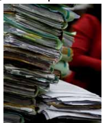
O tempo médio de tramitação de uma sentença no STJ é de 11 meses.

As despesas de todo o Poder Judiciário no ano passado foram R$ 90,8 bilhões, registrando aumento de 4,4% em relação a 2016. Segundo o levantamento, o total de gastos representa 1,4% do Produto Interno Bruto (PIB). As despesas com recursos humanos são responsáveis por 90,5% do gasto total. “A despesa média do Poder Judiciário por magistrado foi de aproximadamente R$ 48,5 mil; por servidor, R$ 15,2 mil; por terceirizado foi de R$ 4,1 mil e por estagiário, R$ 828,76”, diz o relatório.