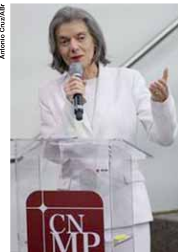
Presidente do STF, ministra Cármen Lúcia.

Entre os avanços conquistados a partir dos processos que permitem maior participação dos cidadãos, Carmen lembrou a Lei da Ficha Limpa, que impede a candidatura de políticos condenados em segunda instância. “A chamada Lei da Ficha Limpa, que mudou após o questionamento