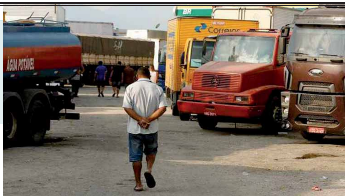
Diante do conflito entre um grupo que aponta para um aumento no custo de produção e outro que alega não conseguir cobrir o custo de seu trabalho, Fux procura um meio termo.