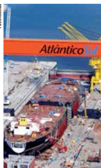
O negócio ajudaria os estaleiros brasileiros a manterem empregos.

Segundo o executivo, o negócio pode atingir alguns milhões de dólares, o que ajudaria os estaleiros brasileiros a manterem empregos até que novas encomendas de navios sejam feitas. Enquanto espera novos projetos do setor do petróleo