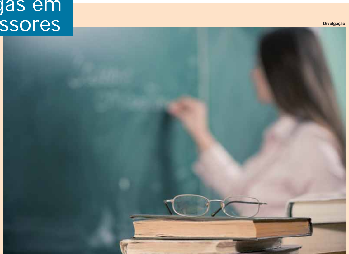
“É uma política que agrega o Pbid, que já existia, foi revigorado e incorpora uma maior participação das universidades, prefeituras e governos estaduais.”

Os editais correspondentes à oferta das bolsas serão publicados amanhã e começarão a ser pagos em agosto. “Essa é uma política pública em que os resultados aparecem a médio e longo prazos. Mas se tivermos a dedicação de todos, os resultados serão alcançados”, acrescentou o ministro (ABr).