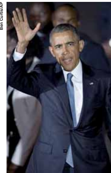
Obama atacou o que chamou de política de “valentão”.

A viagem é a primeira do ex-presidente à África desde que ele deixou a Casa Branca.