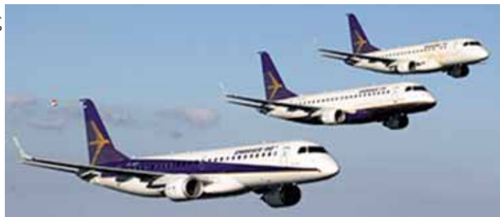
Os anúncios foram feitos durante a Farnborough Air Show.

A fabricante brasileira detalhou que a companhia aérea Republic assinou contrato para 100 aeronaves com opção para adquirir mais 100. A Mauritânia Airlines adquiriu dois E-175, avaliados em US$ 93,8 milhões. Já a Azul assinou uma carta de intenção para 21 aeronaves E195-E2, o maior avião da família mais moderna de jatos