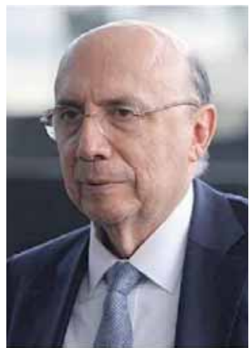
Pré-candidato à presidência pelo MDB, Henrique Meirelles.

Ele destacou o crescimento das intenções de votos no seu nome, e avaliou que a melhora perante da opinião pública está vindo antes do esperado. Para ele, será apenas uma questão de tempo para que os eleitores