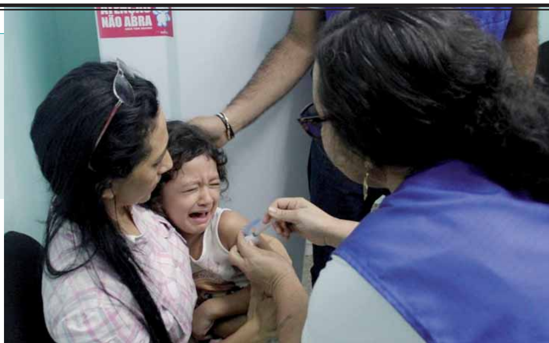
O pico da doença foi registrado no mês de março, quando foram identificados 25.493 casos. A vacinação contra o sarampo é essencial para evitar novos casos.

Ainda segundo a pasta, casos isolados e relacionados à importação foram identificados nos estados de São Paulo (1), Rio Grande do Sul (6); e Rondônia (1). Outros estados têm casos suspeitos, mas que ainda não foram confirmados. Até o momento, o Rio de Janeiro informou oficialmente 18 casos suspeitos e dois casos confirmados de sarampo.