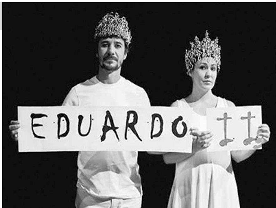
A peça tem como base as obras escritas por dois grandes dramaturgos da história, o alemão Bertolt Brecht (1898-1956) e o inglês Christopher Marlowe (1564-1593)