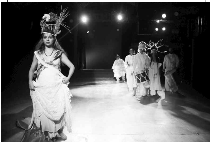
“Rebelião – O Coro de Todos os Santos” encerra temporada no Teatro do Incêndio.

O Teatro do Incêndio encerra a temporada do espetáculo “Rebelião – O Coro de Todos os Santos” no dia 24.