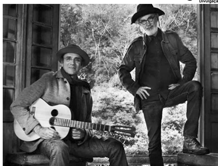
Almir Sater e Renato Teixeira apresentam o show AR.

Compositores referenciais no universo da música caipira, o sul mato-grossense Almir Sater e o paulista Renato Teixeira, depois de mais de 30 anos de amizade e bem-sucedidas parcerias musicais, estão juntos novamente em