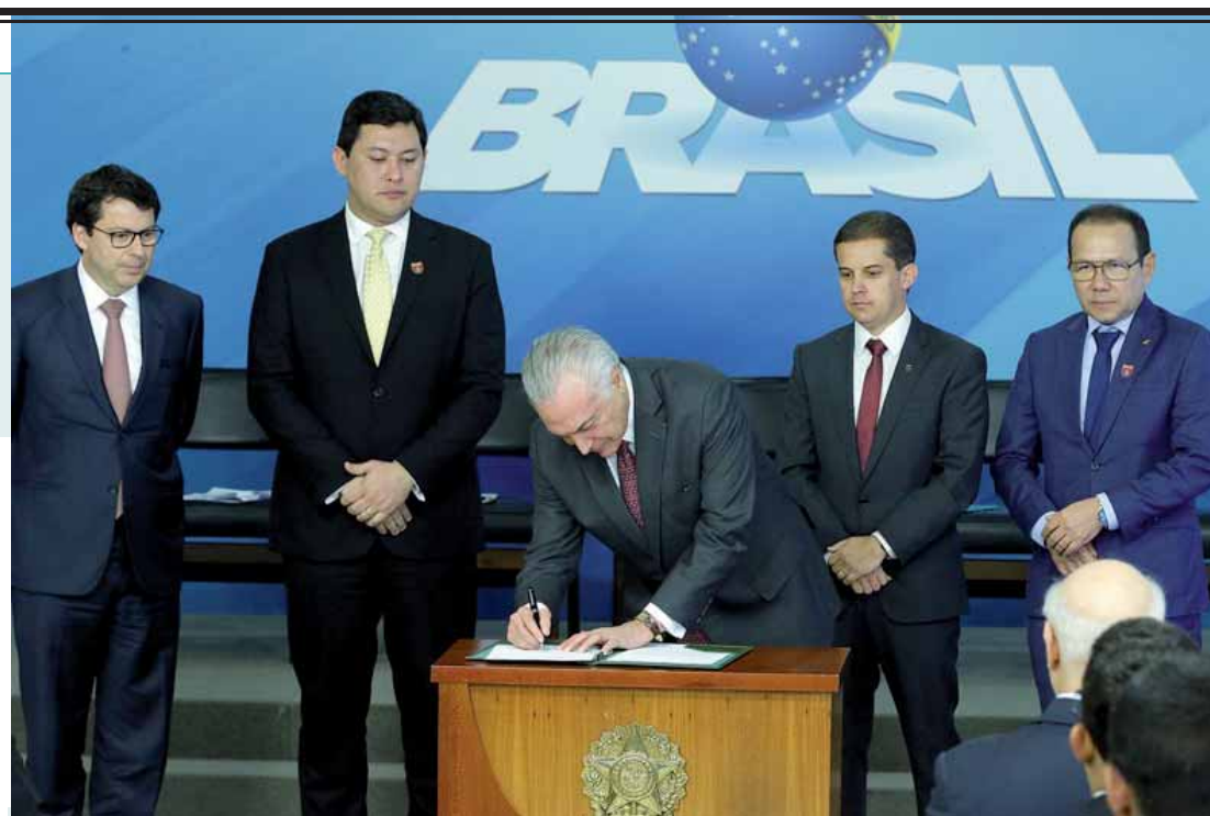
Presidente Michel Temer durante sanção da lei e assinatura do decreto que regulamentam os saques das contas inativas do PIS/Pasep, em cerimônia no Palácio do Planalto.

O público total beneficiado pela medida é de 28,7 milhões de pessoas e, dessas, cerca de 3,6 milhões já fizeram o saque