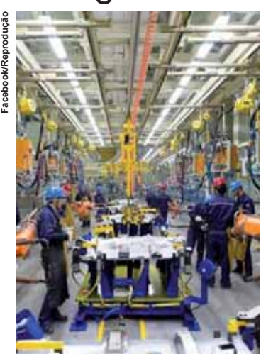
A indústria automobilística convocou jornadas extras de produção.

O início da Copa do Mundo representa um obstáculo adicional porque as empresas devem dispensar os funcionários ao menos no horário dos jogos da seleção brasileira. A forma como os dias parados na greve serão repostos também abriu uma queda de braço entre fabricantes e sindicatos dos