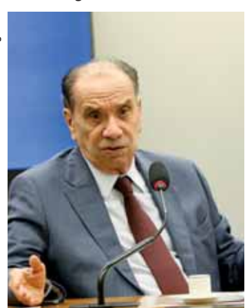
Ministro das Relações Exteriores, Aloysio Nunes.

Questionado sobre a posição do Itamaraty em relação à Venezuela, reiterou que o Brasil