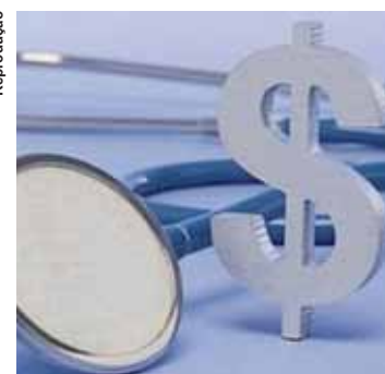
A ANS disse, em nota, que vai recorrer da decisão proferida da Justiça.

A Ação Civil Pública movida pelo Idec teve como base relatório do Tribunal de Contas da União (TCU) que aponta distorções, abusividade e falta de transparência na metodologia usada para calcular o