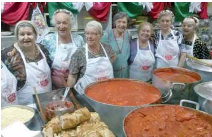
'Mammas' da Festa de São Vito.

A tradicional Festa de São Vito, comemorada no bairro do Brás, completa 100 anos neste sábado (15). São Vito é padroeiro da cidade italiana de Polignano a Mare, na Puglia, sul da Itália, e é considerado protetor dos artistas, dos pacientes de doenças nervosas, dos jovens e dos dependentes de drogas. Vito recebera uma formação cristã, mas foi denunciado por seu próprio pai ao imperador Diocleciano.