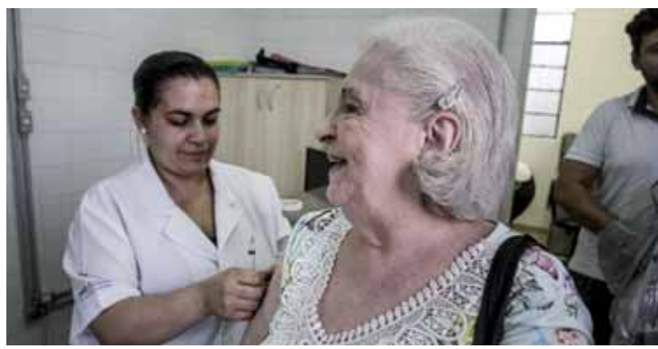
Neste ano, a vacina protege contra o H1N1, influenza B e o H3N2.

O mutirão também terá como foco professores das redes pública e privada, trabalhadores da área de saúde, povos indígenas, profissionais do sistema