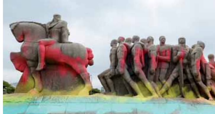
Monumento às Bandeiras, no Ibirapuera, pichado em 2016.

Começou a tramitar no Senado o projeto que cria punição na esfera civil para quem pichar ou depredar patrimônio privado ou público. Assim, quem fizer isso terá que reparar o dano causado e ainda indenizar o proprietário pagando o correspondente ao dobro do valor do estrago. O autor do projeto, senador Reguffe (sem partido-DF) observa que a Lei 9.605/1998 já prevê até um ano de detenção para quem fizer pichações.