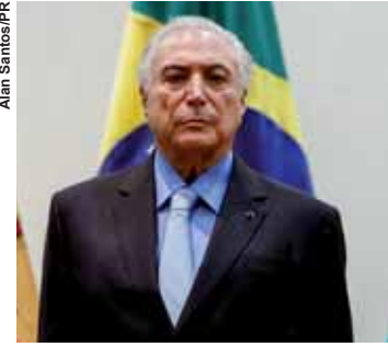
Presidente Michel Temer.

rio de Relações Exteriores do evento do Dia do Diplomata, comemorado com a formatura da turma 2017-2018 do curso de formação de diplomatas do Instituto Rio Branco. Temer destacou o respeito conferido à diplomacia brasileira no exterior e ressaltou a importância da presença das mulheres no corpo diplomático.