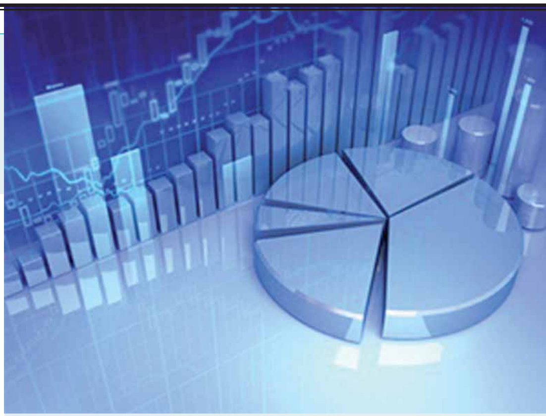
A maioria dos Estados passou o primeiro bimestre sem investimentos e com as receitas comprometidas com o pagamento de pessoal.

O relatório do Tesouro também apontou uma elevada dependência dos Estados do Norte e Nordeste de recursos transferidos pelo governo federal. Amapá, Acre, Maranhão, Alagoas, Sergipe e Paraíba têm mais de 50% das suas receitas decorrentes de transferências da União. No Amapá, esse valor chega a 84%. Segundo o coordenador de Normas de Contabilidade do Tesouro, Bruno Ramos Mangualde, os Estados do Mato Grosso do Sul, Pará, Piauí, Paraná, Rio Grande do Norte, Roraima e o Distrito