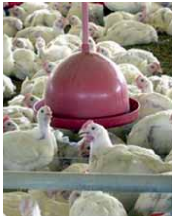
Frango poderá ficar mais barato para o consumidor.