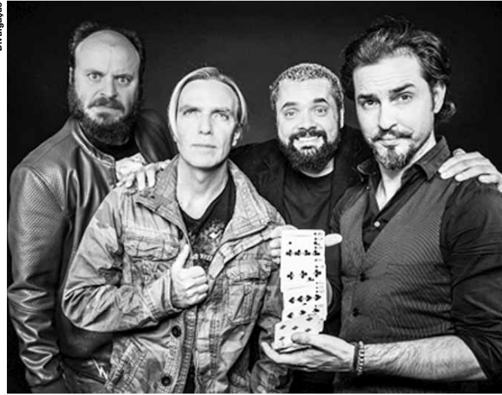
Cena de "1 Melhor que o Outro".

Serviço: Teatro Morumbi Shopping, Av. Roque Petroni Júnior, 1069, tel. 5183-2800. Sextas às 23h. Ingresso: R$ 50. Até 25/05.