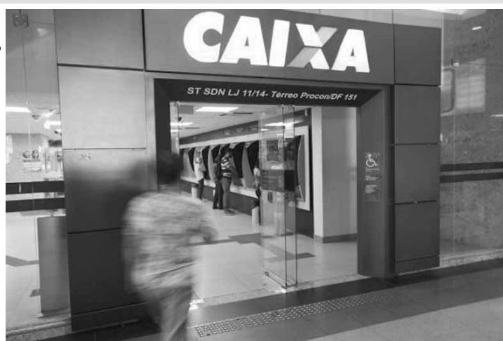
O crescimento em relação a 2016 foi de 202,6%, segundo o banco.

“Esse desempenho ocorreu devido à retração de 15,3% na carteira comercial e foi compensado pelo crescimento de 6,3% das operações de