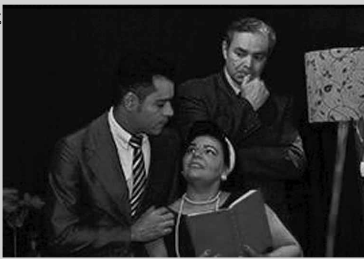
Cena do "Drama de Outono".

Serviço: Teatro do Ator, Pça Roosevelt, 172, Consolação, tel. 3257-3207. Sábados às 18h. Ingresso: R$ 40. Até 28/04.