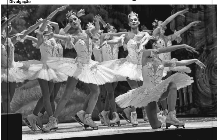
Ballet Estatal de São Petersburgo no Gelo.

O Ballet Estatal de São Petersburgo no Gelo chega pela primeira vez ao Brasil. Com prestígio internacional, a companhia une o esplendor da dança clássica ao profissionalismo da patinação artística, fascinando, por mais de 40 anos, públicos de todas as idades e culturas ao redor do mundo. No palco, eles apresentarão o espetáculo "A Bela Adormecida".