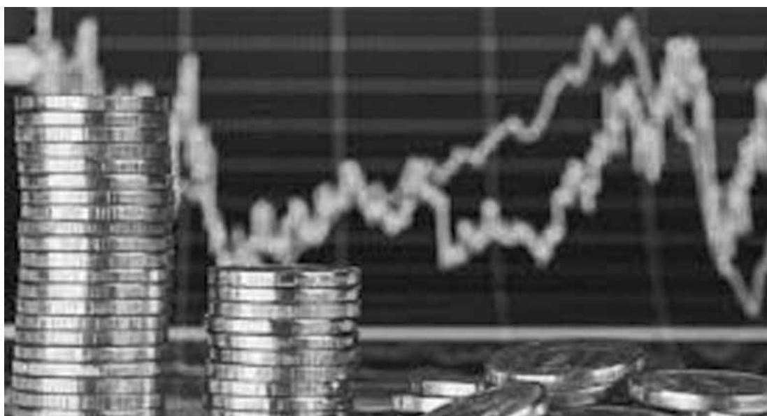
O destaque foi o crescimento das atividades de agropecuária (8,2%), transformação (6,1%), comércio (4,6%) e transporte (2,9%).

Na comparação com o trimestre encerrado em janeiro de 2017, o PIB avançou 2,2%, segundo a FGV. O destaque foi o crescimento das atividades de agropecuária (8,2%), transformação (6,1%), comércio (4,6%) e transporte (2,9%). O crescimento da agropecuária foi influenciado pela alta de 26% da pecuária. A agricultura, por sua vez, teve queda de 1,9%. Ainda na comparação com o trimestre encerrado em janeiro de 2017, pela ótica da demanda, o consumo das famílias aumentou 2,7% e a formação bruta de capital fixo (investimentos) avançou 4,4%.