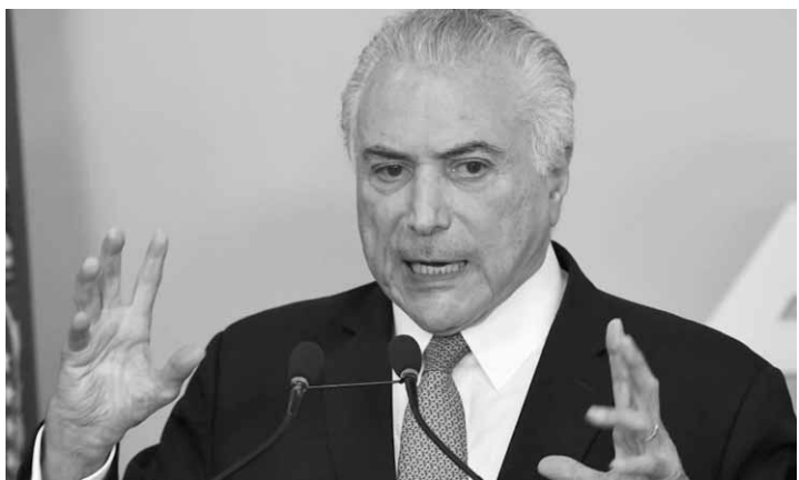
Presidente Michel Temer.

"Estou vendo agora uma declaração feita pela Casa Branca que o Brasil é um dos países com quem começarão as negociações visando a eventual exceção às tarifas sobre importação de aço e alumínio. As novas tarifas, diz a mensagem da Casa Branca, não se aplicarão enquanto estivermos conversando sobre o tema. Uma boa notícia", disse o presidente, durante reunião