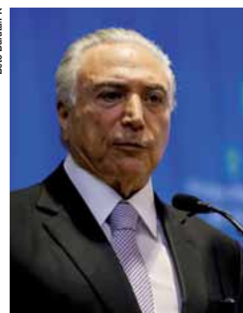
Presidente Temer na abertura do 8º Fórum Mundial da Água.

“O acesso à água está intimamente ligado à capacidade de crescer de forma sustentável. Em nome do futuro da humanidade, é nossa obrigação compartilhada buscar o desenvolvimento sustentável em todas suas vertentes. O consenso é de que a vida na Terra estará ameaçada se não respeitarmos os limites da natureza”, disse o presidente em seu discurso de abertura, no Itamaraty, ao lado de chefes de Estado que participaram do fórum.