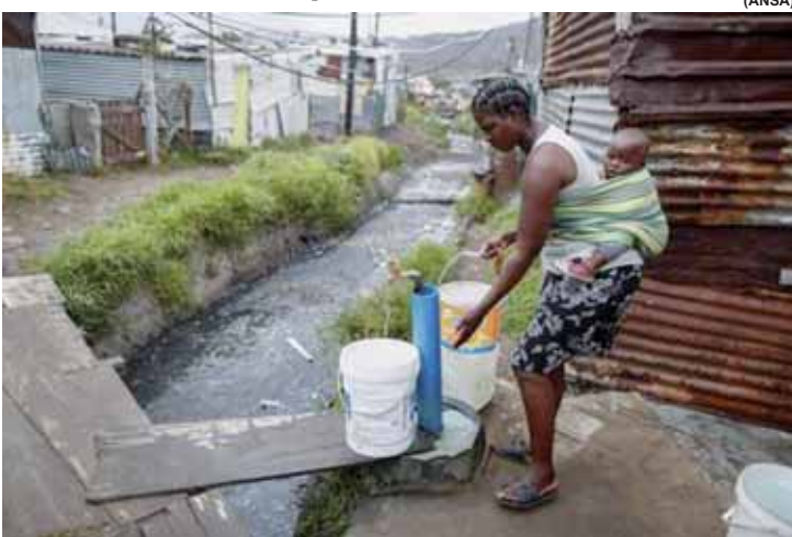
Relatório é um dos destaques do 8º Fórum Mundial da Água.

A falta de água pode afetar 5 bilhões de pessoas até 2050, segundo um relatório da ONU que será apresentado no 8º Fórum Mundial da Água, em Brasília. A estimativa a ONU alerta que, pelo menos durante um mês do ano, 5 bilhões de pessoas ficarão sem água até 2050, o que corresponde à metade da população mundial estimada para a data.