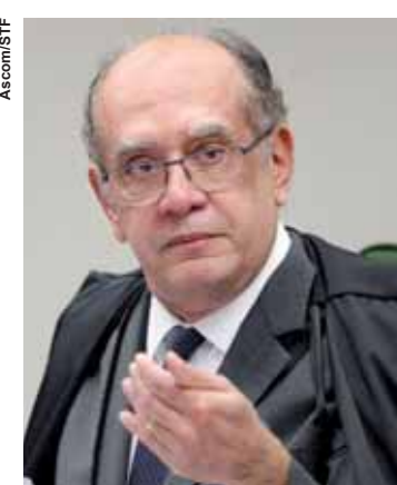
Ministro do STF, Gilmar Mendes.

O ministro foi alvo de manifestantes, que jogaram tomates em seu veículo na saída do evento, na capital paulista. Ao comentar o protesto, o ministro ressaltou que “isso é democracia”. O ministro disse que ainda não teve acesso ao habeas corpus coletivo impetrado por dez advogados do Ceará para impedir a prisão de todos os que já estão cumprindo prisão