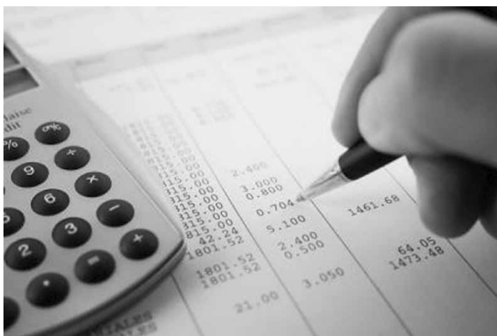
Setor de serviços lidera pedidos de recuperação judicial.

De acordo com os economistas da Serasa Experian, apesar do ano de 2017 ter sido marcado pelo fim da recessão de 2015/16, nem todos os setores econômicos conseguiram exibir um bom desempenho, como o setor primário, por exemplo (queda de 5,0% para 3,3% nos pedidos de recuperação judicial). Neste sentido, o setor de serviços, ainda com baixo dinamismo no ano passado e que passando