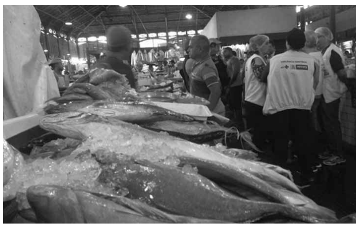
Equipes de auditoria fiscal agropecuária do governo federal fiscalizam qualidade do pescado.