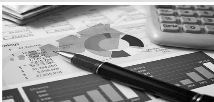
A estimativa para o crescimento do PIB também foi mantida para 2018 em 2,7%.

A estimativa para o crescimento do Produto Interno Bruto (PIB), a soma de todos os bens e serviços produzidos no país, também foi mantida para 2018 em 2,7%. Há quatro semanas, o índice era inferior,