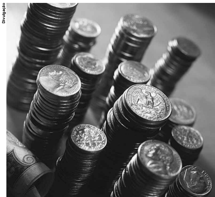
O FMI também prevê crescimento global de 3,9% para 2018 e 2019.

Divulgado ontem (22), o relatório World Economic Outlook destaca que a atividade econômica global registrou crescimento previsto de 3,7% em 2017, 0,1 ponto percentual acima do proje-