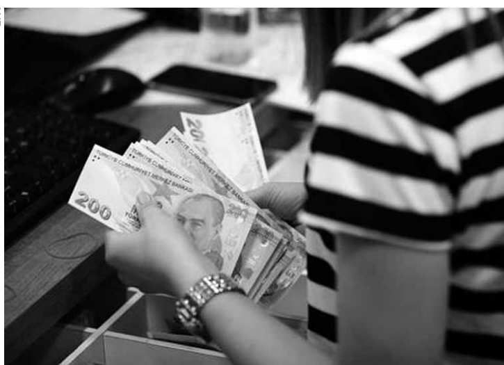
Moeda turca acumula desvalorização de 41%.

A lira chegou a ter desvalorização de 9% com relação ao dólar, antes de o governo lançar um plano econômico para conter a desvalorização da moeda do país. Na última sexta-feira (10), a lira chegou a cair 16%, o que causou quedas em diversas bolsas de valores pelo mundo. O Banco Central turco anunciou a injeção de US$ 6 bilhões no sistema financeiro do país para garantir a liquidez dos bancos