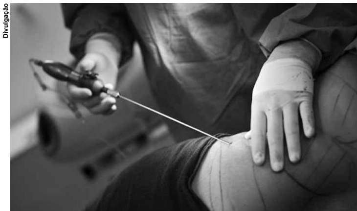
"O paciente precisa estar ciente dos riscos e escolher um profissional qualificado".