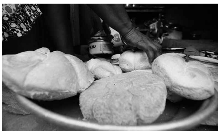
Sem fermento, era preparado com cereais selvagens na Jordânia.

Tal evidência antecipa 4 mil anos da primeira documentação desse alimento e foi descoberta no nordeste da Jordânia, em um local que foi populado por caçadores do Mesolítico. Os estudiosos não