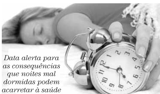
Data alerta para as consequências que noites mal dormidas podem acarretar à saúde

"O Dia Mundial do Sono tem como objetivo alertar o mundo sobre a importância de tratar as perturbações do sono. Pesquisas comprovam o aumento de incidência de acidente vascular cerebral e insufici-