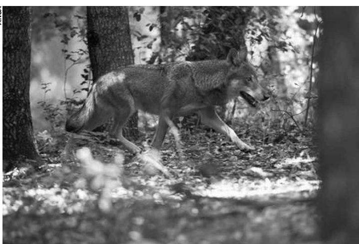
População quer "retirada controlada" da espécie.

O pedido solicita à União Europeia que sejam "tomadas as medidas necessárias para a redução do nível de proteção do lobo" e cobra de Roma ações "imediatas" para permitir a "retirada controlada" da espécie do Alto Ádige, em "harmonia" com as diretivas de Bruxelas.