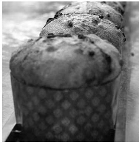
Analistas advertem para que preço não seja associado à qualidade.

classe A ou gemas de ovo em uma porcentagem que não seja inferior a 4%, além de um mínimo de 16% de manteiga, passas, frutas cítricas secas confeitadas (pelo menos 20%) e fermento natural.