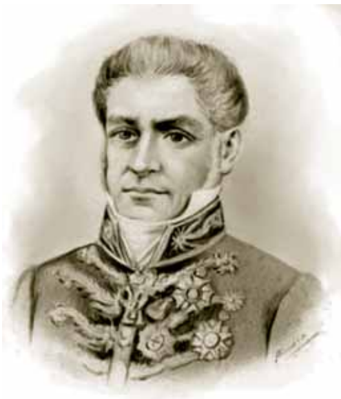
Senador Marquês de Caravelas. O fogo temido por ele realmente ocorreria, mas 191 anos mais tarde, em 2018.

Julgo oportuno que o Senado autorize o governo a proceder aos trabalhos preparatórios para uma nova construção, levantando as plantas das obras e designando o local apropriado e o orçamento da despesa". A proposta de Pereira foi aprovada, mas o governo não chegou a projetar um novo palácio imperial.