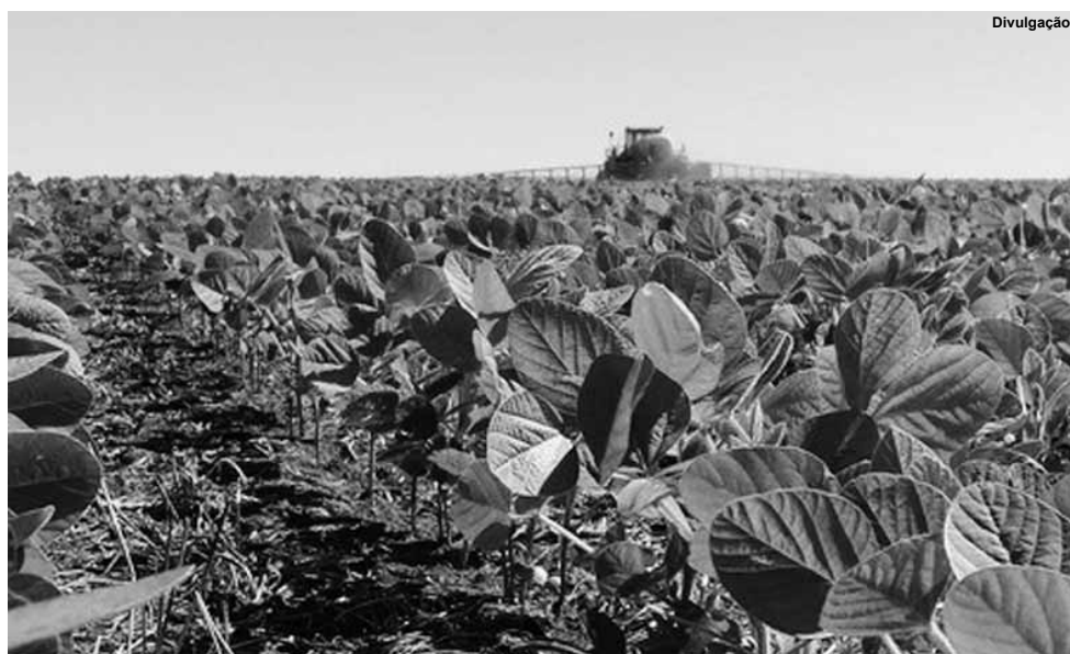
Fertilizantes são insumos essenciais para a produção de alimentos e matérias primas de origem agrícola.

Imagine quanto nutriente é subtraído do solo com grãos, carnes, fibras, etc, que saem das fazendas e são levados para as cidades distantes ou para outros países, lembrando que o Brasil é um dos maiores exportadores mundiais de alimentos. Nessas condições, não há como repor os nutrientes exportados por meio da reciclagem com adubos orgânicos, daí a importância dos adubos minerais.