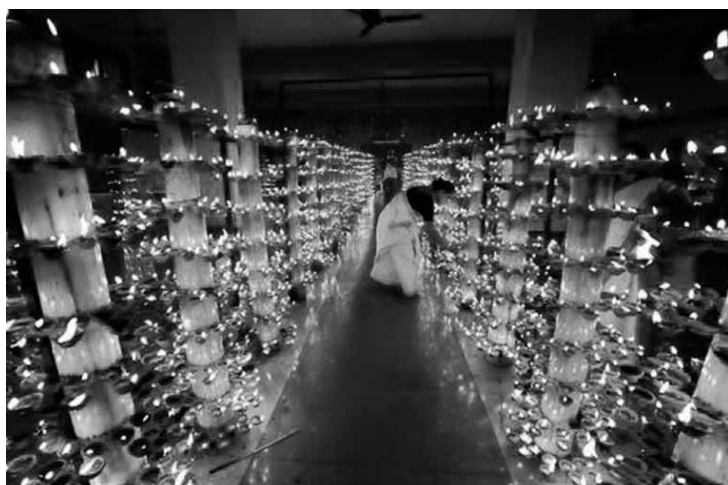
Local vetava entrada de cidadãs em idade menstrual.

A atual regra proíbe o acesso de mulheres de 10 a 50 anos no templo, já que elas são consideradas impuras por estar em idade menstrual. Na Índia, a menstruação é um tabu que provoca discriminação contra as mulheres e força muitas delas a realizarem histerec-