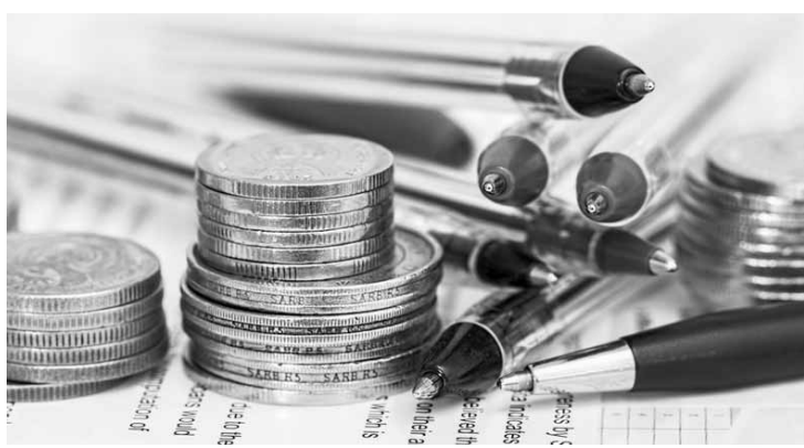
O Copom enfatizou a necessidade de reformas e ajustes na economia brasileira para a manutenção da inflação baixa.

“Todos avaliaram que, na ausência de choques adicionais, o cenário inflacionário deve revelar-se confortável. Entretanto, o maior nível de incerteza da atual conjuntura gera necessidade de maior flexibilidade para condução da política monetária. Os próximos passos da política monetária continuarão dependendo da evolução da atividade econômica, do balanço de riscos e das projeções e expectativas de inflação”, diz a ata da reunião