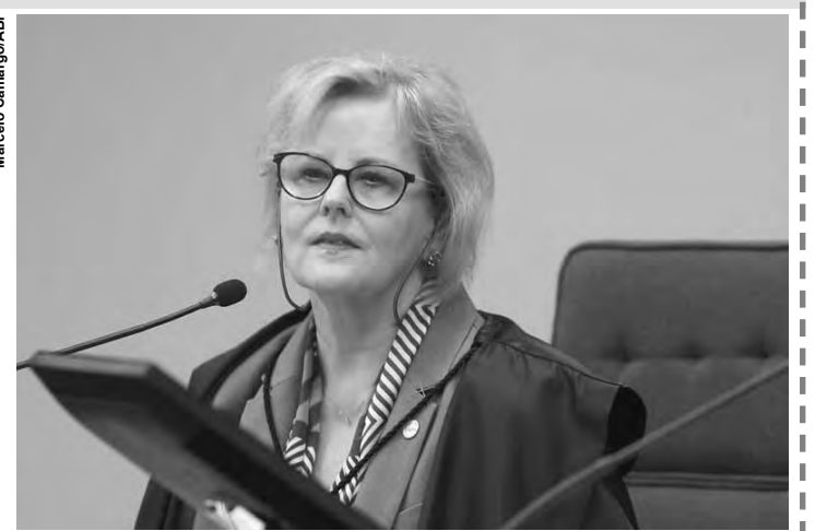
Ministra do STF, Rosa Weber.