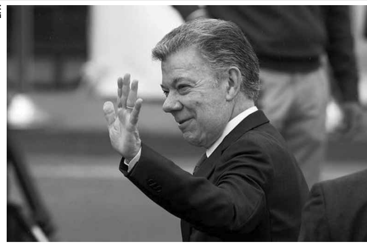
Juan Manuel Santos deixa o cargo de presidente da Colômbia para o eleito Iván Duque.

Balço: De 488 militares e policiais mortos em 2010, o número caiu para 83 em