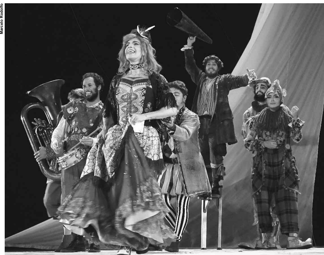
Cena de "Suassuna – O Auto do Reino do Sol".