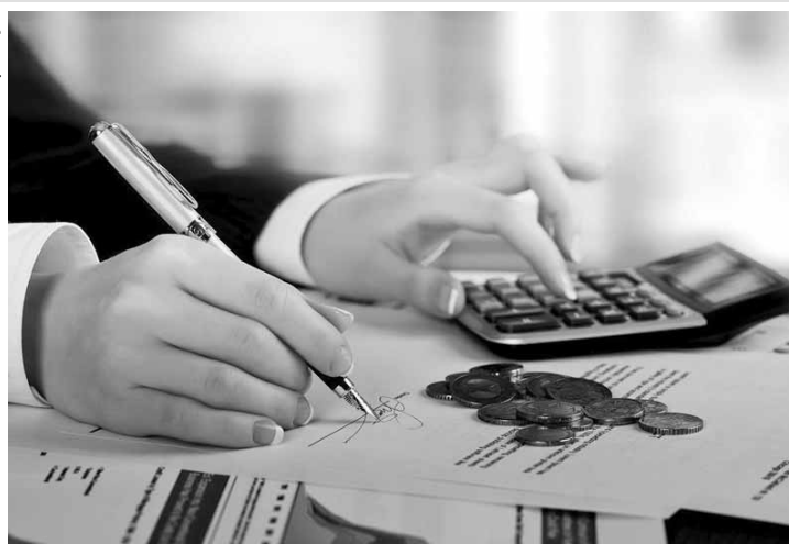
O cenário de incertezas políticas e econômicas faz com que os paulistanos tenham mais cautela no crédito.

De acordo com o levantamento, o Índice de Segurança de Crédito, que mostra a parcela de consumidores com alguma reserva financeira, deteriorou-se pelo segundo mês consecutivo. O índice caiu 5%, ao passar de 82,1 pontos em junho para 78 pontos em julho. Essa retração foi motivada, principalmente, pelo recuo na segurança de crédito dos não endividados, cujo indicador retraiu 6,4%, passando de 100,5