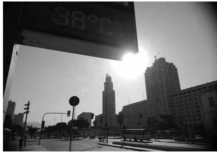
A temperatura média global aumenta 0,17 graus a cada década.

Estes elementos de retroalimentação incluem descongelamento do pergelissolo (solo