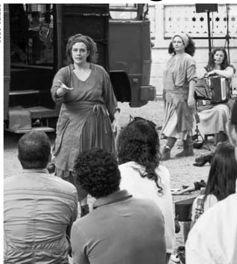
Cena da peça "Quem vem de longe".