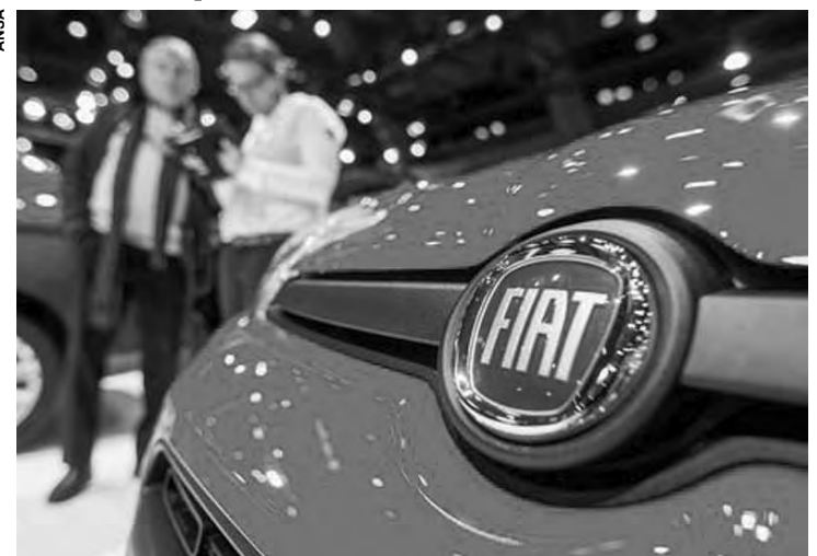
O último exemplar foi produzido no fim de julho, em Melfi.

O estilista italiano Giorgetto Giugiaro foi um dos responsáveis pelo visual do modelo. O sucesso do compacto foi responsável por renovações que criaram três gerações do modelo. A primeira, produzida de 1993 até 1999, chegou a ter 3,5 mil exemplares diários saindo da fábrica da Fiat em Melfi. A segunda durou até 2005, ano em que a marca lançou a