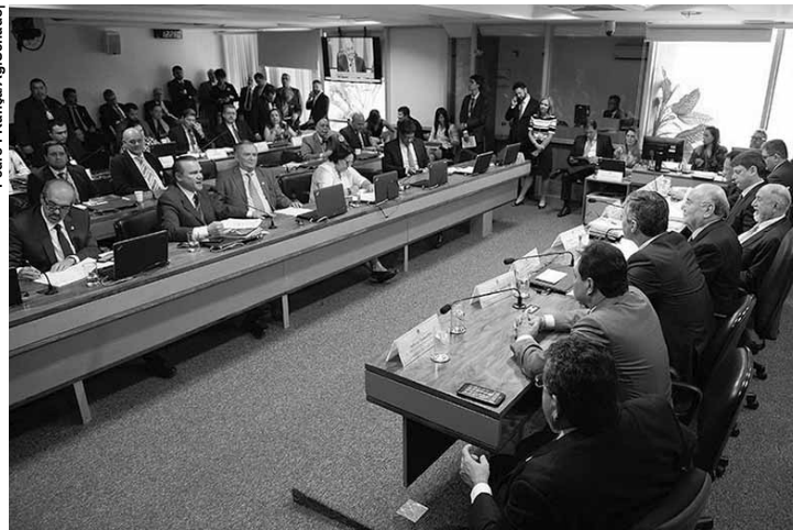
A Comissão de Serviços de Infraestrutura do Senado aprovou programa de incentivo ao uso da bicicleta.

O PBB visa promover a integração das bicicletas ao sistema de transporte público coletivo; apoiar estados e municípios na instalação de bicicletários públicos e na construção de cicloviárias e ciclofaixas; e promover campanhas de divulgação dos benefícios do uso desse meio de transporte. Conforme o projeto, o PBB vai integrar a Política Nacional da Mobilidade Urbana, será financiado por 15% do total arrecadado com multas de trânsito e coordena-