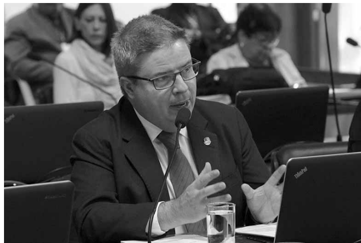
Senador Antonio Anastasia (PSDB-MG), autor da proposta.

A falta de um mecanismo legal de compartilhamento de informações vem trazendo problemas para diversos órgãos com atribuição fiscalizatória, como o Ministério Público; os tribunais de contas; o Conselho Administrativo de Defesa