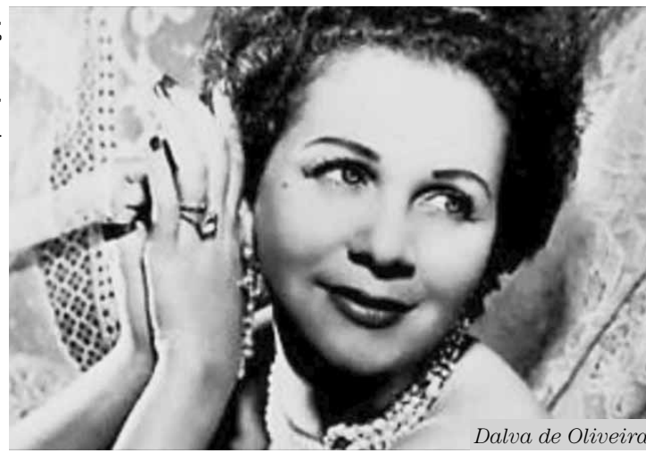
Dalva de Oliveira