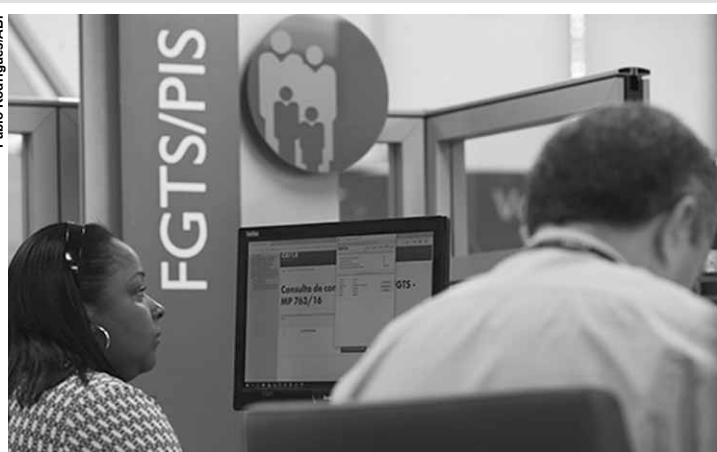
Na segunda etapa, empregados de quaisquer idades poderão solicitar suas cotas.

As cotas são retiradas anuais de recursos depositados em contas de trabalhadores entre 1971 e 1988, quando ficaram inativas em razão da Constituição Federal. Até 2017, o saque era permitido para pessoas com mais de 70 anos, em caso de aposentadoria e em outras situações específicas. A partir do ano passado, o