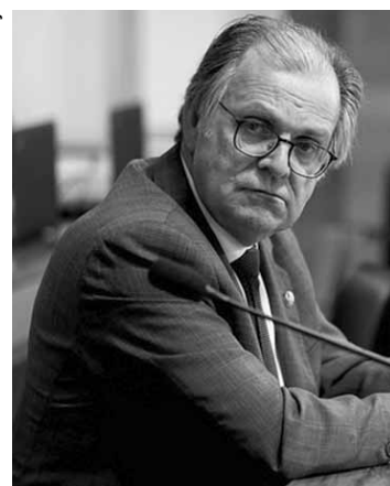
Senador Dalvírio Beber PSDB-SC.

Ele reiterou que não haverá reposições no caso de vacância no serviço público, a não ser nas áreas de educação, saúde, segurança pública, defesa, assistência social. Os reajustes que já foram aprovados de forma parcelada ou escalonada também não serão