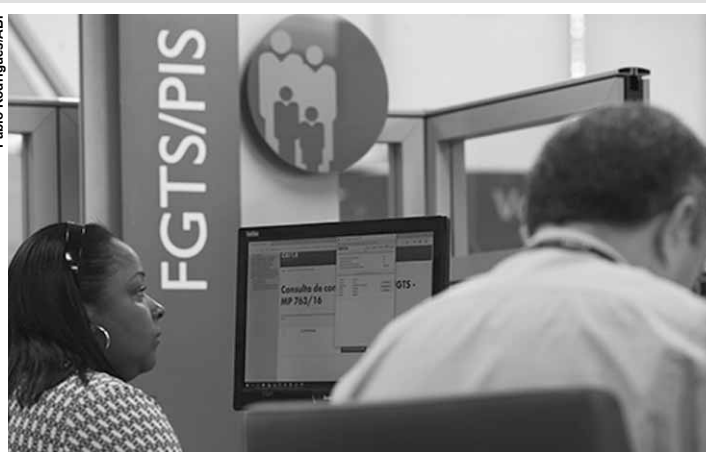
Na segunda etapa, empregados de quaisquer idades poderão solicitar suas cotas.

As cotas são retiradas anuais de recursos depositados em contas de trabalhadores entre 1971 e 1988, quando ficaram inativas em razão da Constituição Federal. Até 2017, o saque era permitido para pessoas com mais de 70 anos, em caso de aposentadoria e em outras situações específicas. A partir do ano passado, o