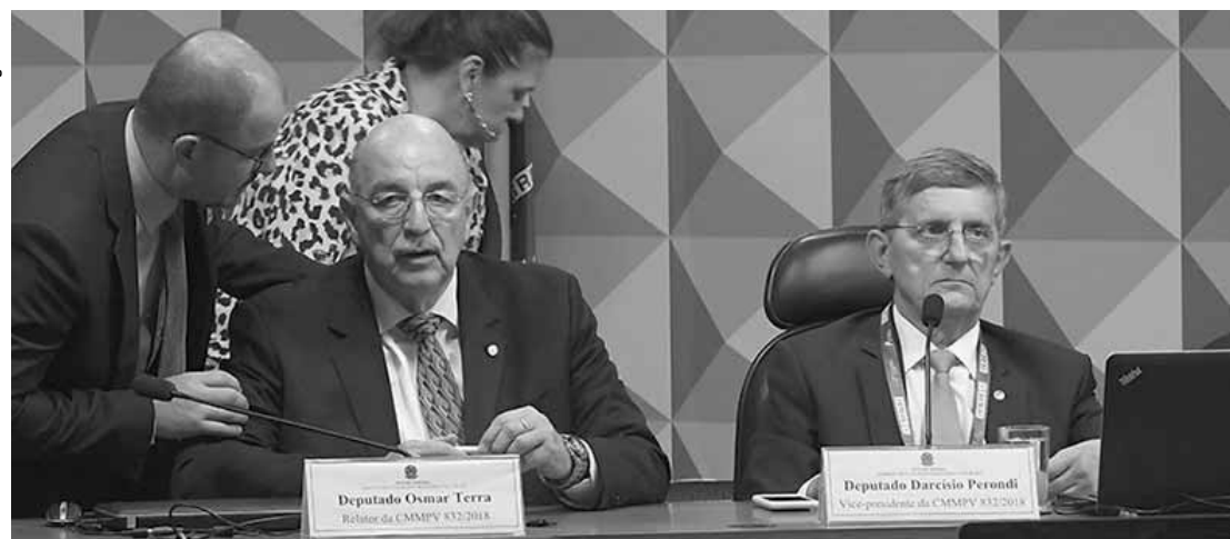
O projeto apresentado pelo deputado Osmar Terra, concede anistia às multas ocorridas em virtude das paralisações entre os dias 21 de maio e 4 de junho.

O texto também prevê a participação de representantes dos setores contratantes e embarcadores dos fretes no processo