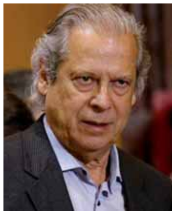
Argumentos da defesa do ex-ministro José Dirceu, faz escola.

"E, assim como se reconheceu em relação ao coacusado [Dirceu], que teve sua liberdade concedida, os recursos do petionário têm o condão de reverter sua condenação ou, ao menos, rever os elevados pata-