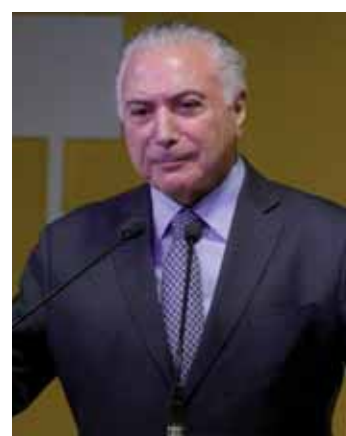
O presidente Temer discursa no lançamento do Plano Safra 2018/2019 do Banco do Brasil.

Dos R$ 103 bilhões destinados pelo Banco do Brasil para o financiamento da safra agrícola 2018/2019, R$ 11,5 bilhões são