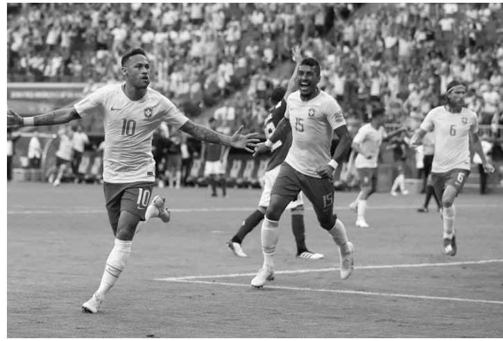
O Brasil chega para a fase de quartas de final com atuações cada vez melhores.

O contra o México mostrou um time com sistema defensivo bem ajustado, pronto para resistir à pressão. E lá na frente, o ataque tem se mostrado mais entrosado e eficiente. Os uruguaios, junto com o Brasil, têm a melhor defesa da Copa, com apenas um gol sofrido. Suárez e Cavani têm sido cada vez mais eficientes no ataque. Cavani fez