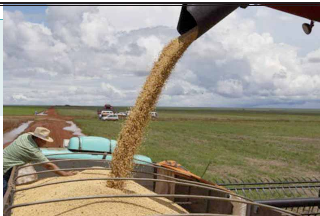
A CNA entende que o preço é determinado em função da oferta e da demanda e o tabelamento de preços mínimos cria distorções.

"Ao contrário do parecer do relator sobre a constitucionalidade do tabelamento, a CNA, em consonância com o Cade e Ministério da Fazenda, entende que, em um mercado concorrencial, o preço é determinado em função da oferta e da demanda e o tabelamento de preços mínimos cria distorções, estimulando a ineficiência econômica, além de ser clara-