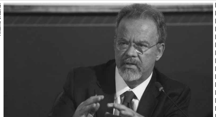
Ministro da Segurança Pública, Raul Jungmann.

O ministério informou que apenas oito estados repassam os dados sobre os boletins de ocorrência de forma regular ao Sistema Nacional de Informações de Segurança Pública (Sinesp). Alguns estados, como o Pará e todos da região Sudeste, incluindo o Rio de Janeiro, que está sob intervenção na área de segurança pública desde fevereiro, estão