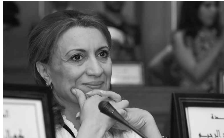
Souad Abderrahim, eleita prefeita de Túnis.

"A minha eleição mostra que as mulheres são capazes de ocupar o primeiro lugar. Dedico essa vitória à Tunísia e ao sucesso das mulheres tunisianas", afirmou. A luta contra a discriminação de gênero é uma das suas principais bandeiras, mas as suas posições, em relação à família, são claras e tradicionais. A prefeita definiu a vitória, ainda, como um "evento histórico que pode riscar a imagem de Tunísia". Abderrahim admitiu que ser a primeira mulher prefeita é uma responsabilidade, mas assegurou que cumprirá todas