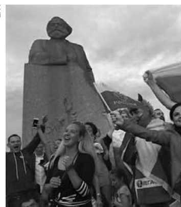
Desacreditada no começo, Rússia vem surpreendendo.

Segundo o levantamento, apenas 8% da população russa acreditava que a seleção venceria a Espanha. Além disso, dos 71% que acompanharam o jogo, somente 46% arriscou uma possível vitória da equipe da casa. Após empatar no tempo regulamentar por 1 a 1, a histórica e dramática classificação da Rússia aconteceu nas disputas de pênaltis, graças ao arremate defendido pelo goleiro Igor Akinfeev.