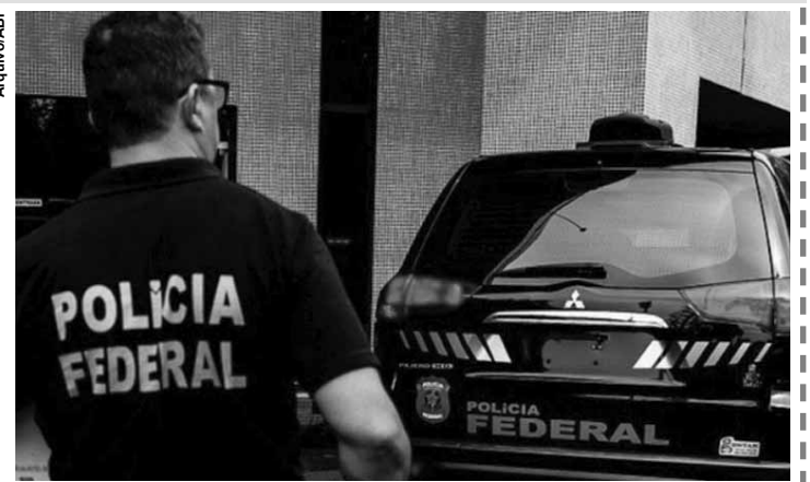
A operação contou com a participação de cerca de 180 agentes federais.