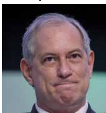
Pré-candidato do PDT à Presidência, Ciro Gomes.

Ciro reagiu. "Pois é, vai ser assim mesmo. Se quiserem presidente fraco, escolham um desses aí que vêm com conversa fiada para vocês". Em seguida, pediu que a plateia colocasse a "mão na consciência". "50 milhões de compatriotas nossos