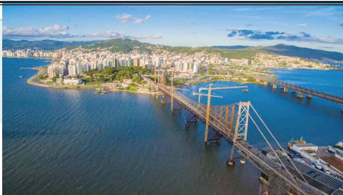
Florianópolis foi a capital que manteve a liderança no ranking que mede o desenvolvimento socioeconômico dos municípios.

Na parte de baixo da lista de desenvolvimento das capitais aparecem Macapá (0,6446),