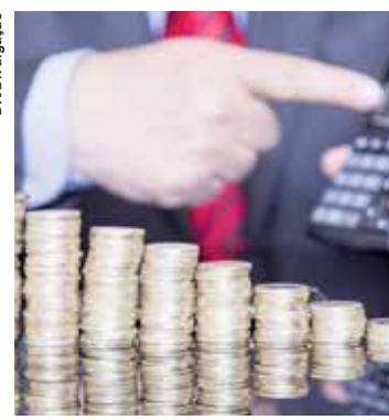
Mercado reduz projeção do crescimento da economia.

A estimativa para o crescimento da agropecuária subiu para 1,9%, ante estimativa de recuo de 0,3% em março, após crescimento anual de 13% em 2017. Já a projeção para o desempenho da indústria foi revista de 3,1% para 1,6%. Para o setor de comércio e serviços, a estimativa de expansão ficou