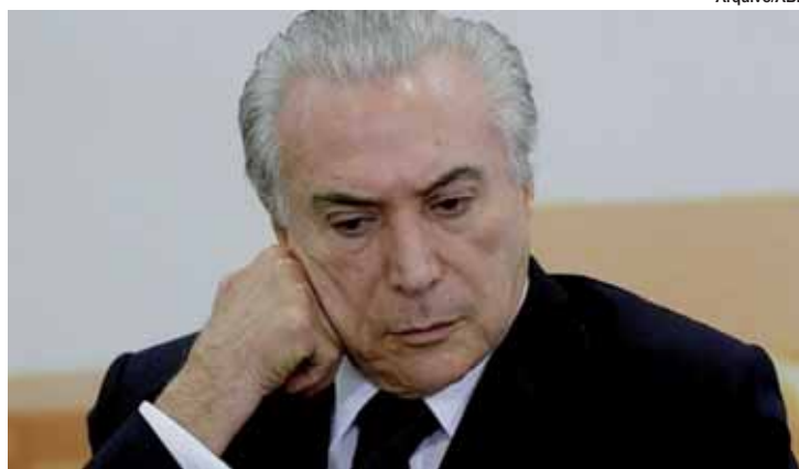
Aumentou a insatisfação da população com o governo.

A pesquisa Pesquisa CNI-Ibope, divulgada ontem (28), apontou que o percentual de confiança no governo Michel Temer recuou de março para junho, passando de 8% para 6%, assim como, em proporção inversa, cresceu o número de pessoas, de 67% para 74%, que acreditam que o restante do atual governo será ruim ou péssimo.