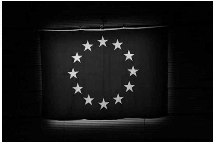
Os brasileiros ficaram em 10º lugar no total de requerimentos de cidadania.

Os brasileiros, se somados os pedidos de nacionalidade em todos os países da União Europeia, ficaram em 10º lugar no total de requerimentos (21.500). Em primeiro lugar ficou o Marrocos, com 101.100 naturalizações na UE, seguido da Albânia (67.500) e da Índia