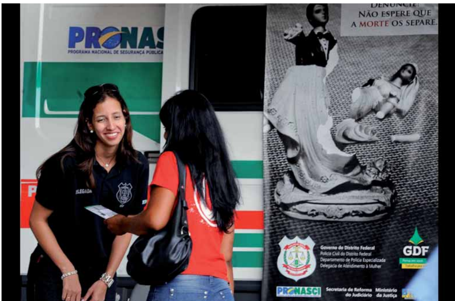
Policia de Brasília entrega cartilha com orientação sobre violência doméstica.