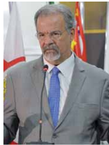
Ministro da Segurança Pública, Raul Jungmann.

Para o ministro, a medida é necessária para evitar que os chefes do crime organizado continuem a agir de dentro das cadeias, em uma situação que Jungmann chamou ironicamente de "home office"