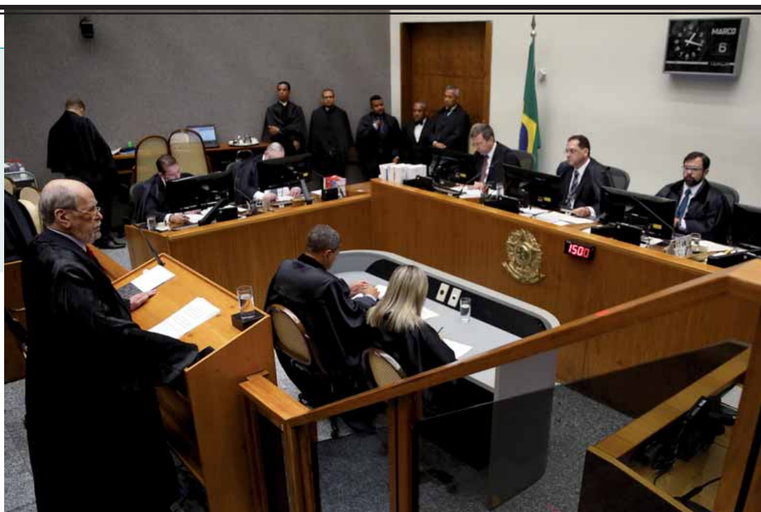
Quinta Turma do STJ, que julgou pedido do ex-presidente Lula para evitar prisão após condenação em segunda instância.