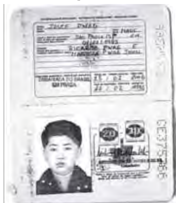
Passaporte com a foto de Kim Jong-un ainda jovem e com o nome fictício de “Josef Pwag”.