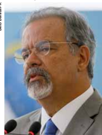
Ministro da Segurança Pública, Raul Jungmann.

“A União precisa ampliar suas responsabilidades e coordenar e promover a interação entre os entes federativos, estados e municípios. Este ministério, como aqui dito, vai coordenar