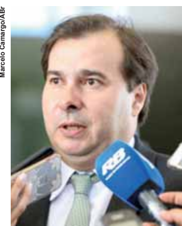
Presidente da Câmara, Rodrigo Maia.

Maia também defendeu a criação do Ministério da Segurança e que o governo Temer tomou a decisão correta. Temer teve a “coragem que outros presidentes não tiveram” ao criar o ministério. “Para o presidente Fernando Henrique,