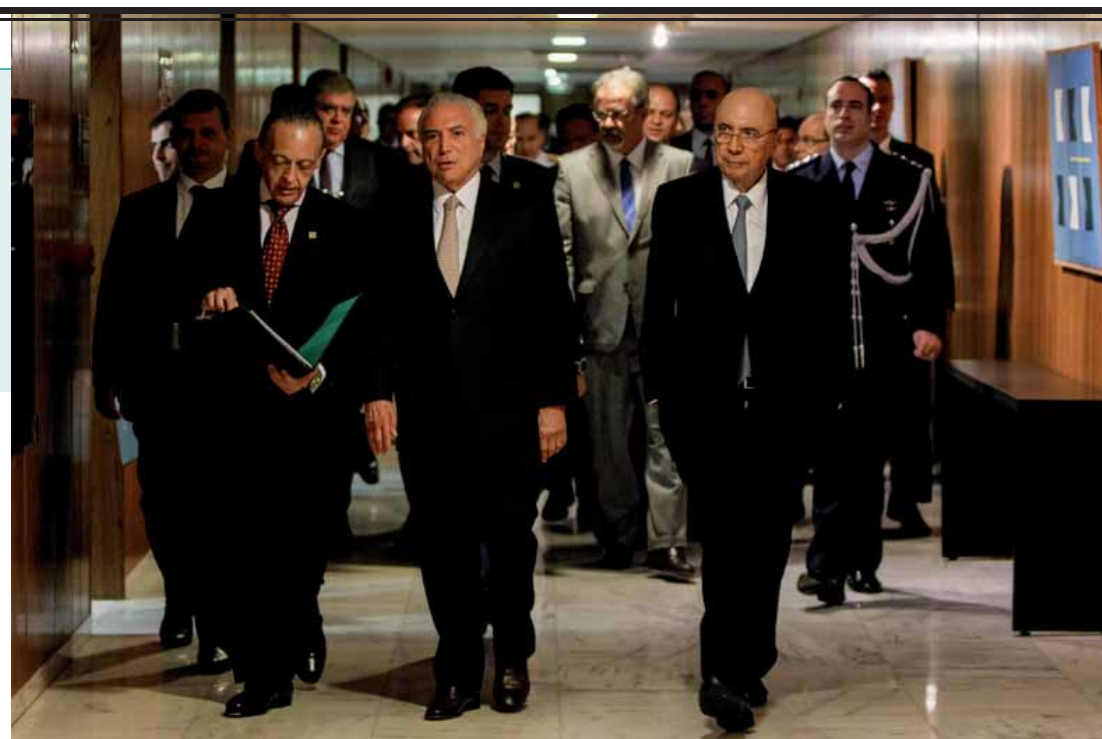
Cerimônia de Posse do Ministro de Estado Extraordinário da Segurança Pública, Raul Jungmann.

Temer afirmou, em uma rápida entrevista após a cerimônia de posse de Raul Jungmann como ministro da Segurança, que vai avaliar “caso a caso” ajuda para segurança pública para outros