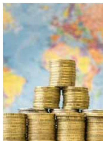
É um programa para a venda de títulos públicos federais por meio da internet.

O Tesouro Direto é um programa do Tesouro Nacional – desenvolvido em parceria com a Bolsa de Mercadorias e Futuros e Bovespa (Bolsa de Valores de São Paulo) – BM&F Bovespa – para a venda de títulos públicos federais para pessoas físicas, por meio da internet. Ele foi criado em 2002 para democratizar o acesso aos títulos públicos, permitindo aplicações com apenas R$ 30.