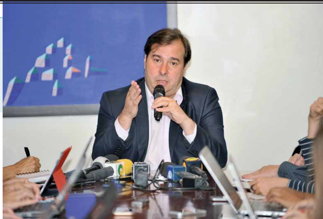
Maia instituiu a criação da comissão de juristas para elaborar o anteprojeto da Lei de Improbidade administrativa.

No pacote de grupos de trabalho, Maia instituiu a criação da comissão de juristas para