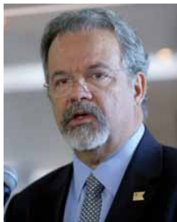
Raul Jungmann assume o comando do Ministério da Segurança Pública.

A criação da nova pasta foi antecipada pelo próprio Temer, na última sexta-feira (23). Na ocasião, o presidente explicou que o ministério vai coordenar as ações de segurança pública em todo o país. Ao falar sobre a questão financeira, Temer disse que a nova pasta pode implicar mais gastos para administração pública, mas isso se justifica pela importância do trabalho a ser feito na área da segurança. Com a pasta da segurança pública, o governo passa a ter 29 ministérios. Jungmann está à frente do Ministério da Defesa desde maio de 2016, quando tomou posse prometendo dar prosseguimento aos projetos estratégicos das Forças Armadas. Durante sua gestão, comandou a organização do