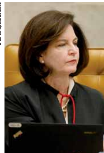
Procuradora-geral da República, Raquel Dodge.

Depois de pedir demissão do cargo de ministro da Indústria e Comércio, em janeiro, Marcos Pereira perdeu a prerrogativa do foro privilegiado. Ele era o único dos investigados que mantinha o inquérito, baseado em delações da Odebrecht, sob a competência do Supremo.