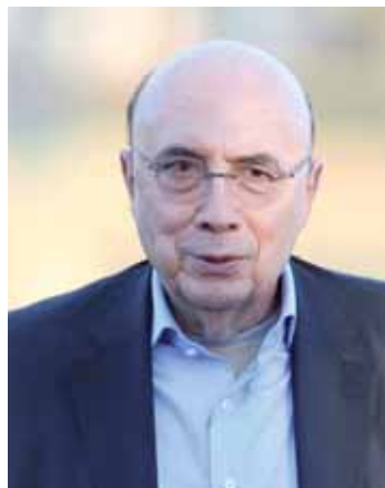
Ministro da Fazenda, Henrique Meirelles.

De acordo com Meirelles, a reunião, às vésperas da volta dos deputados federais e senadores do recesso parlamentar, foi mais um dos tantos encontros da equipe de governo para planejar uma estratégia para conseguir aprovar, no Congresso Nacional, no menor espaço de tempo possível, as mudanças nas normas de aposentadoria. A previsão é que