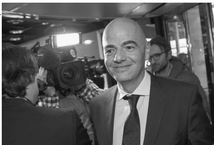
O ítalo-suíço Gianni Infantino, presidente da Fifa.

Ao ser questionado em solo marroquino por esse comentário, Infantino disse que também aprecia a “candidatura do Marrocos”, segundo informou o jornal digital “Le360.ma”. Perante a insistência dos jornalistas, Infantino lembrou