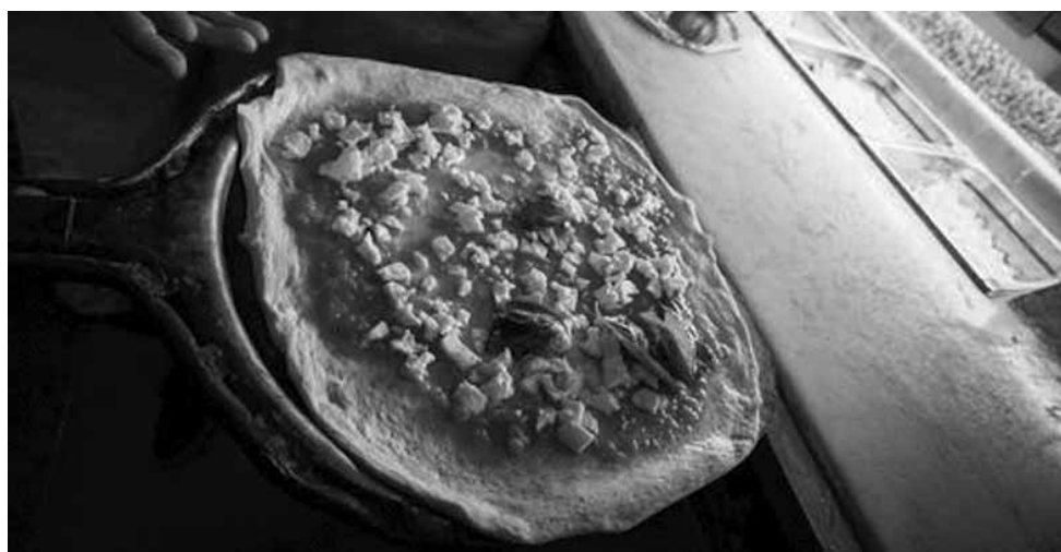
Valor é equivalente à experiência que o cliente teve no local.

Segundo Polli, a ideia surgiu após ele se colocar no lugar de seus clientes. Para ele, pagar uma conta de restaurante não se baseia apenas nos bons pratos pedidos,