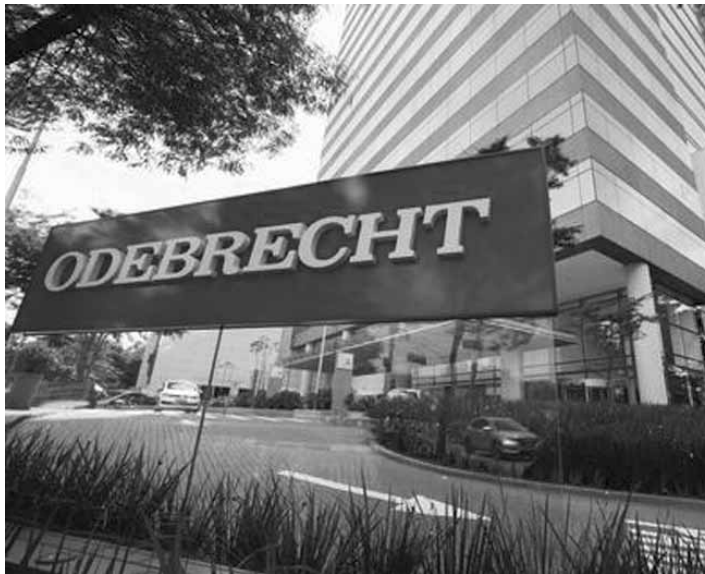
Peru exige reparação pela corrupção praticada pela empresa.