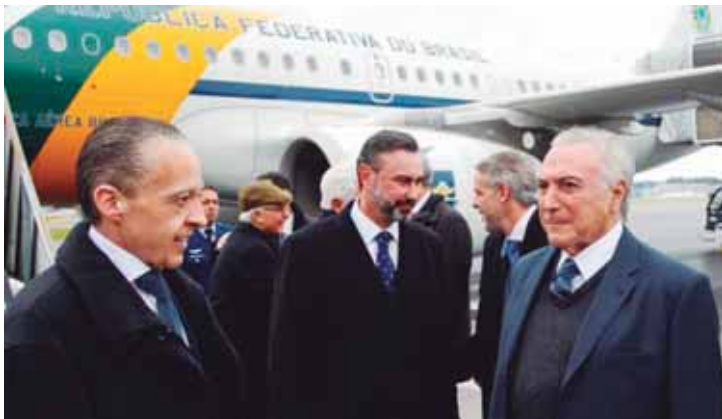
O presidente Temer ao desembarcar na Suíça, onde participa na cidade de Davos do Fórum Econômico Mundial.

O presidente Temer afirmou ontem (23) que o julgamento do recurso do ex-presidente Lula, marcado para hoje (24) no TRF da 4ª Região, em Porto Alegre, será um "evento natural" e que não deve gerar nenhuma instabilidade política. Questionado sobre qual poderia ser o impacto do julgamento, Temer disse que o fato "talvez roube a cena" da abertura do fórum, mas que não deve provocar nenhuma preocupação institucional. "É um evento natural", afirmou.