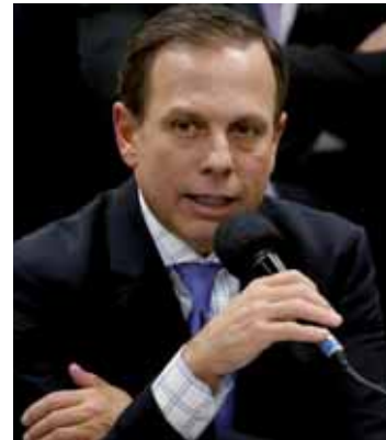
Prefeito João Doria

"Compartilho dessa corrente. Acredito na condenação e na punição do presidente Lula, mas, politicamente, o ideal seria ele ser candidato e derrotá-lo nas eleições de outubro para enterrarmos o mito Lula e aprisionarmos o Luiz Inácio", declarou. A condenação, na visão do prefeito, impõe uma "marca dura" ao ex-presidente Lula e ao PT. "Um partido já criminalizado, com seis processos, ter uma condenação de forma mais clara, terá mais dificuldade em fazer um discurso de salvação do Brasil, de ética, de princípios e de gestão. Creio que o ex-presidente Lula vai seguir sua candidatura, vai usar dos subterfúgios que a legislatura