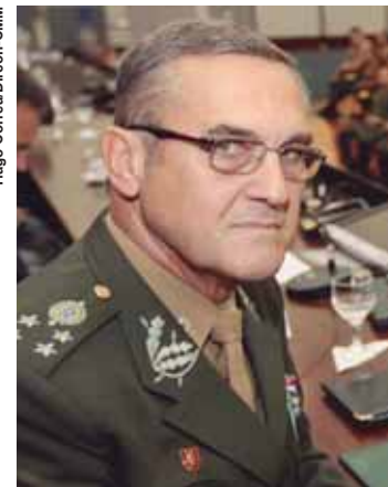
Comandante do Exército, general Eduardo Dias da Costa Villas Bôas.

O general Villas Bôas citou uma pesquisa de opinião que apontava o apoio de mais 40% da população à ideia de intervenção, e disse que tal adesão, por outro lado, reflete a confiança desses setores da