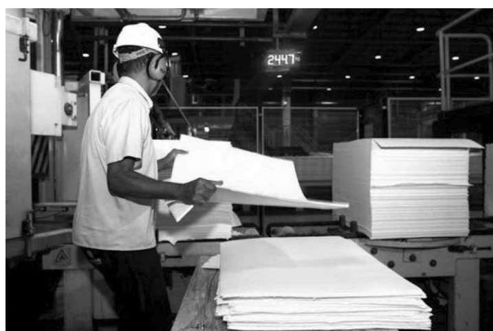
Produção da indústria aumentou 0,2% em novembro e acumula alta de 0,9%.

De outubro para novembro, foram observadas altas nas produções de bens intermediários, ou seja, os insumos industrializados para o setor produtivo (1,4%) e de bens de consumo duráveis (2,5%). Os bens de capital, isto é, as máquinas e equipamentos, se mantiveram estáveis de um mês para o outro, enquanto os bens de consumo semi e