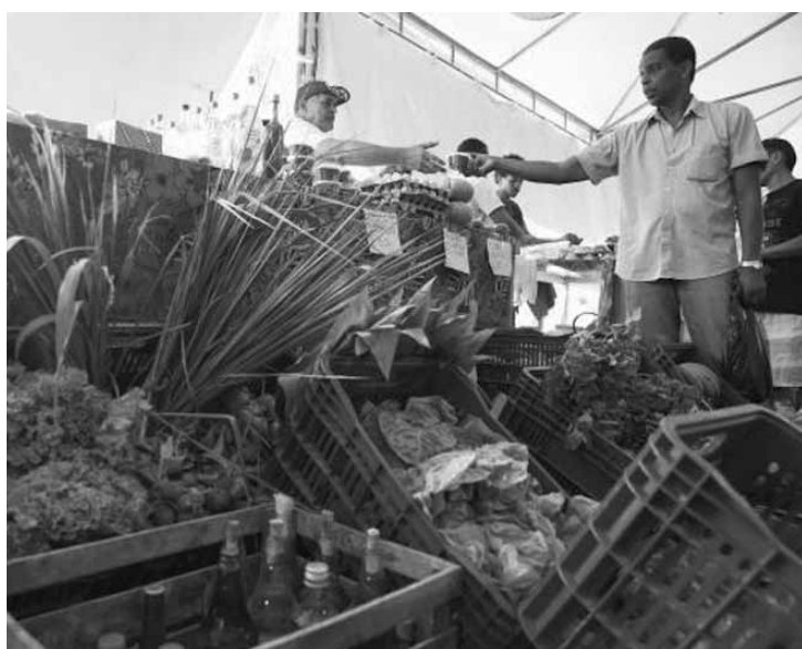
Preço dos alimentos foi o principal responsável pela redução.

O recuo da taxa do IPC-C1 entre 2016 e 2017 foi provocado principalmente pela deflação (queda de preços) de 2,06% dos alimentos no ano passado. Em 2016, o grupo de despesas alimentação havia registrado inflação de 7,10%. Os produtos e serviços de comunicação também passaram de uma inflação em 2016 (3,10%) para uma deflação em 2017 (-0,31%).