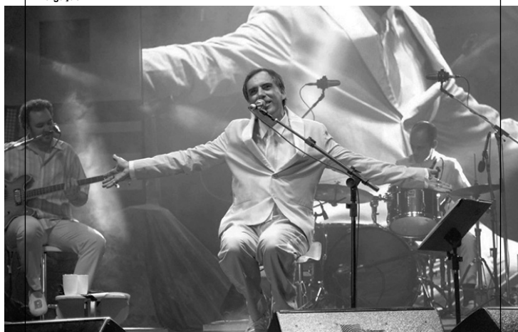
Araldo Antunes apresenta o CD Ao Vivo em Lisboa .