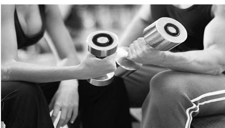
Entre os excluídos, a categoria de personal trainer é a que acumula mais microempreendedores, 35.690.