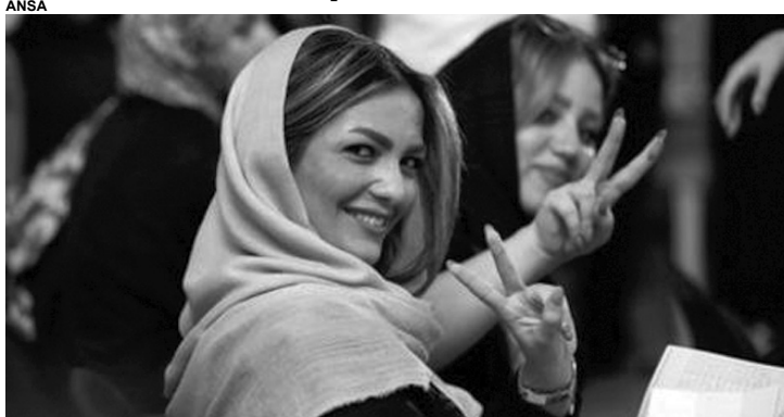
Fim da prisão por desrespeito as normas de vestimenta islâmicas.

As mulheres da cidade de Teerã, capital do Irã, que desrespeitarem as regras de vestimenta islâmica não serão mais presas ou processadas. O anúncio foi feito pelo chefe de polícia da cidade, Hossein Rahimi, na quinta-feira (28), segundo o jornal reformista "Sharq". De acordo com a Revolução Islâmica de 1979, as mulheres devem seguir algumas regras ao se vestir, como por exemplo cobrir o corpo, não usar esmaltes nas unhas ou maquiagem pesada, e não usar lenços largos na cabeça.