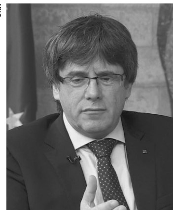
Líder catalão, Carles Puigdemont, segue autoexilado na Bélgica.

O segundo partido mais votado foi o Junts per Catalunya, partido do ex-presidente Carles Puigdemont, que segue autoexilado na Bélgica. Conquistou 34 assentos que, se somado aos 32 do ERC (Esquerda Republicana da Catalunha) e aos quatro assentos da CUP (Candidatura de Unidade Popular), resulta em 70, que é maioria absoluta. Dessa forma, os separatistas conquistaram o direito de indicar o próximo presidente.