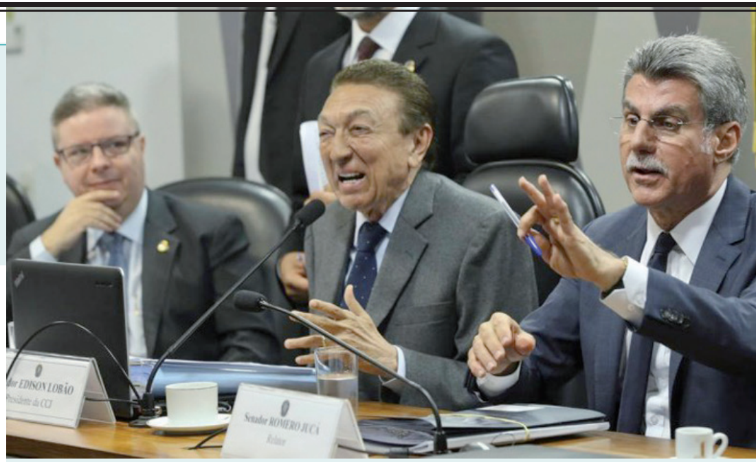
Debate sobre a reforma trabalhista na Comissão de Constituição e Justiça: senadores Antonio Anastasia, Edison Lobão e Romero Jucá, da esquerda para a direita.

Eunício reclamou que já se passaram cerca de 40 dias desde a sanção da proposta no Senado, sem que haja uma manifestação clara do governo sobre a medida provisória. "Todo mundo está esperando. Qual é a lei que entrou em vigor? A MP que foi negociada ou vai ser apenas o