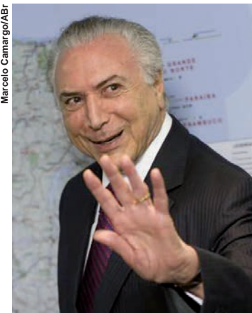
Temer na reunião com o presidente da Anfavea e dirigentes das empresas associadas.

Segundo ele, o novo programa é uma "evolução" dos pontos positivos do Inovar Auto e não deve estimular aumento ou redução dos preços dos automóveis, pois as empresas poderão ficar isentas dos reajustes