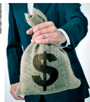
Em 2022, o Brasil terá 296 mil milionários.

O estudo aponta uma mudança na origem dos milionários, que antes eram mais concentrados nos países mais maduros. Outra questão que mostra a pesquisa é a distribuição de renda. Segundo o documento, 3,5 bilhões de adultos tem