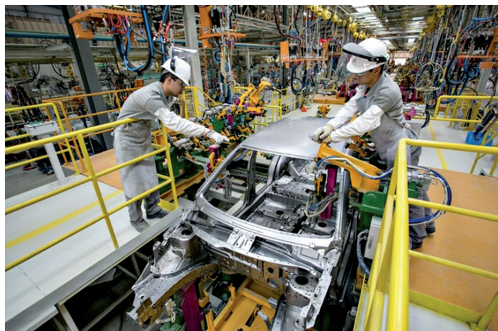
Depois de ter passado por uma recessão muito grande, já há de fato uma recuperação.

Os números são "indícios iniciais de recuperação lenta após longo ciclo recessivo". As primeiras informações sobre o último trimestre "são positivas e reforçam a perspectiva de melhora da atividade". "Não é uma recuperação retumbante. Mas o nosso cenário de crescimento de 0,7% para o PIB neste ano vai se mostrando cada vez