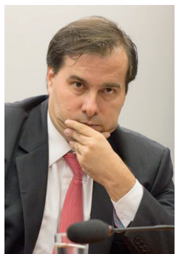
Presidente da Câmara, Rodrigo Maia.

"Essa interferência do Poder Executivo tem sido crescente, infelizmente, nesse governo na relação com o Parlamento, que é de muito diálogo, sim, mas na hora de decisão, [há] muita edição de medida