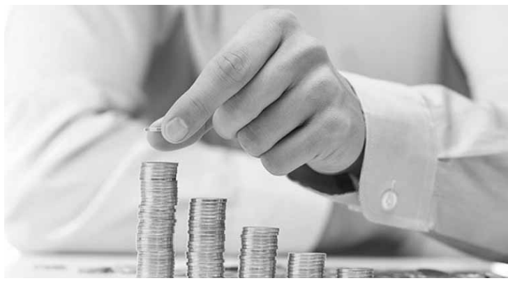
Na composição das carteiras, os fundos se destacam.

Na composição das carteiras, os fundos se destacam, com