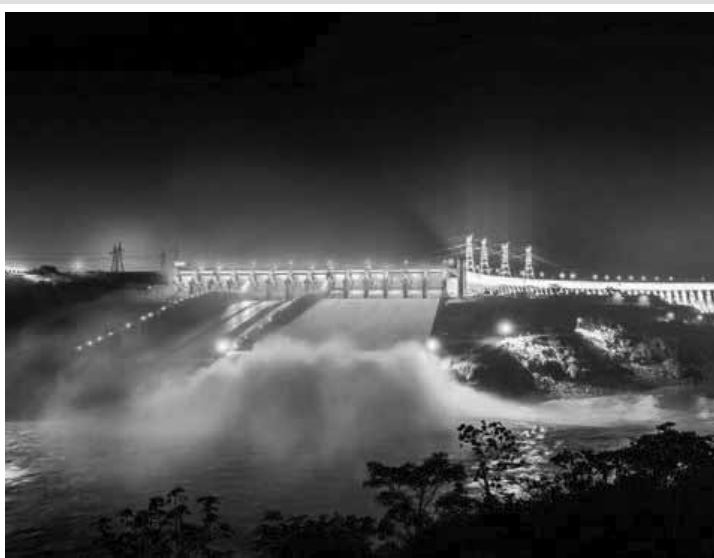
Usina Hidrelétrica de Itaipu, da Eletrobras.

O balanço do trimestre indica também que a receita ope-