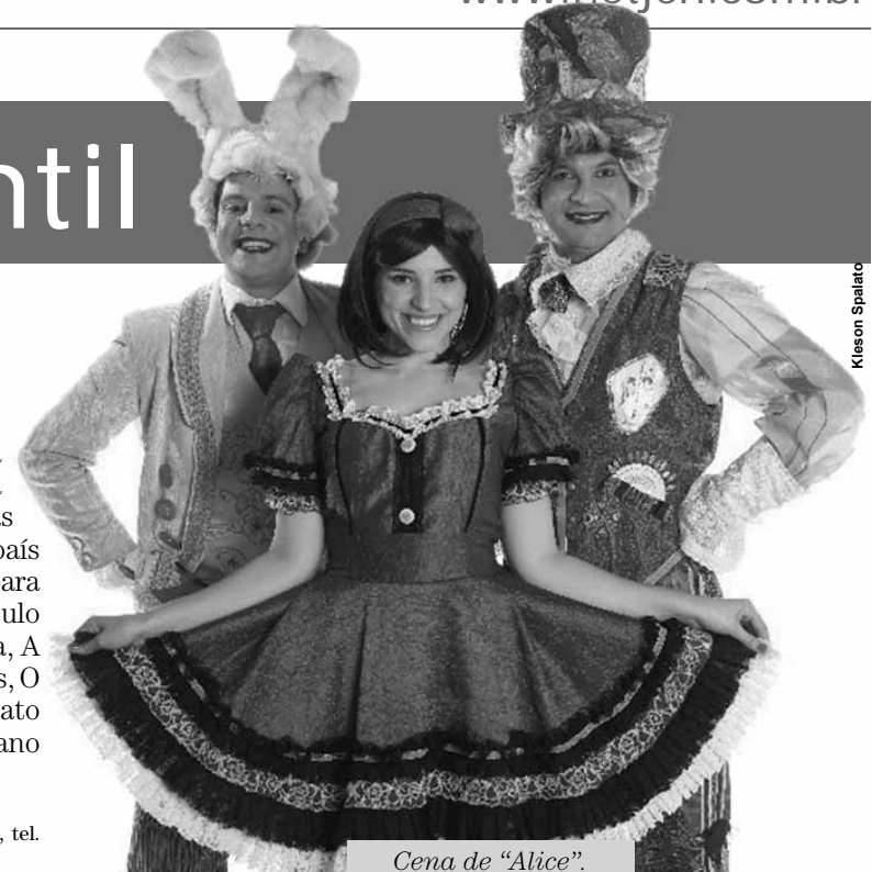
Cena de "Alice".

Serviço: Teatro Porto Seguro, Al. Barão de Piracicaba, 740, Campos Elíseos, tel. 3226-7300. Sábados e domingos às 15h. Ingresso: R$ 60. Até 25/11.