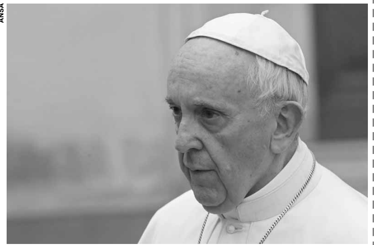
O papa Francisco apelou para que as pessoas evitem sentimentos negativos.

Na audiência, o papa mencionou os ensinamentos do Novo Testamento, que destaca que todos os homens são iguais independentemente de sua etnia e credo religioso. "[Aquele que mantém] sentimentos de desconfiança, medo, desprezo e até ódio contra indivíduos ou grupos considerados diferentes por causa de sua etnia, origem e religião, como tal, não é digno o suficiente para participar plenamente na sociedade."