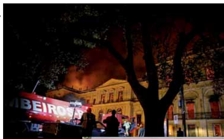
O governo quer realizar uma campanha internacional para recompôr, mediante doações e aquisições, o acervo do Museu Nacional.

O presidente Michel Temer deu apoio pessoal a esta