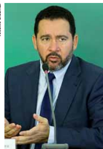
Presidente do BNDES, Dyogo de Oliveira.

O BNDES vai repassar R$ 25 milhões para financiar projetos executivos de segurança e prevenção de incêndios e modernização de museus, arquivos e instituições. O edital deve ser publicado até o fim deste mês. Segundo o presidente do BNDES, Dyogo Oliveira, as instituições ligadas ao patrimônio cultural do país poderão apresentar propostas e solicitar parte da verba. Também foi anunciada a