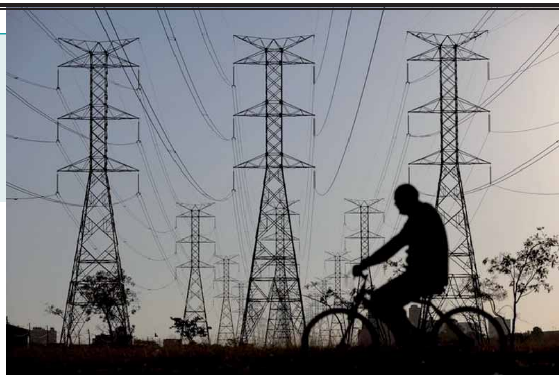
O impacto médio previsto nas tarifas será de 1,6% para os consumidores dos estados do Centro-Sul e de 0,3% do Norte e Nordeste.