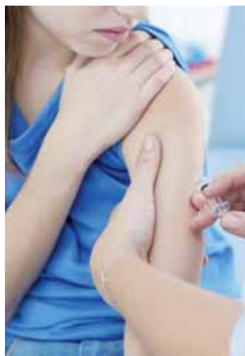
Vacinar meninas de 9 a 14 anos e meninos de 11 a 14 anos contra o HPV.

Desde a incorporação da vacina HPV no Calendário Nacional de Vacinação, 4 milhões de meninas de 9 a 14 anos procuraram as unidades do SUS para completar o esquema com a segunda dose, totalizando 41,8% das crianças a serem vacinadas. Com a primeira dose, foram imunizadas 4 milhões de meninas nesta mesma faixa, o que corresponde