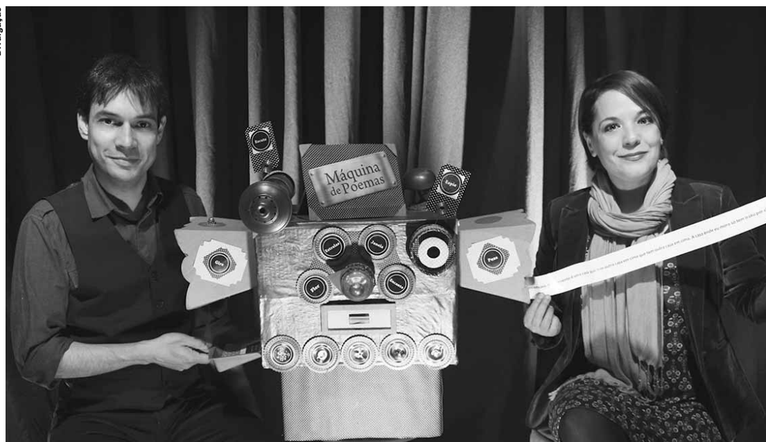
A Cia. Prana Teatro com o espetáculo "O Valente Meio Frango e Outros Contos Birutas".

A Cia traz quatro contos populares de origem europeia, onde reis, rainhas, bobos da corte, bichos que falam e outros personagens são representados por meio de bonecos, figuras de teatro de papel. A primeira história "Joca, o Boboca e o Grifo", conta sobre o terceiro filho de um camponês que é considerado um bobo. Mas coisas incríveis acontecem no decorrer da história, e o rei percebe que Joca não é bobo. Em "O Valente Meio