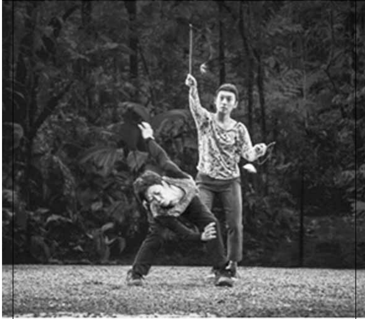
Espectáculo de dança Sim.

Um espetáculo de dança em que cinco bailarinos criam a peça em tempo real, num espaço cênico construído com meia tonelada de pedras britas.