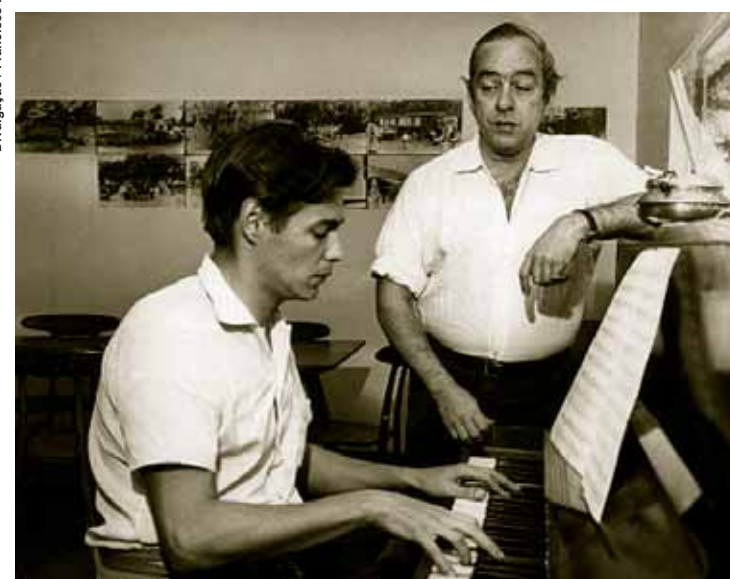
Tom Jobim toca piano ao lado do poeta Vinícius de Moraes.