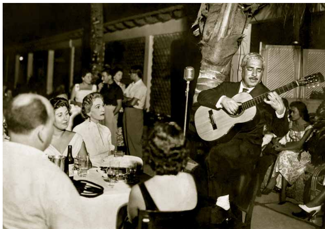
Caymmi toca violão em uma boate carioca. Autor de sambas-canção na década de 1950, ele teve músicas regravadas por João Gilberto com a batida de violão da bossa nova.

Devido a problemas financeiros e de saúde do cantor, a filha dele Bebel Gilberto conseguiu a interdição do músico no último dia 15 de novembro. O processo corre em segredo de justiça na 5ª Vara de Órfãos e Sucessões do Rio de Janeiro.