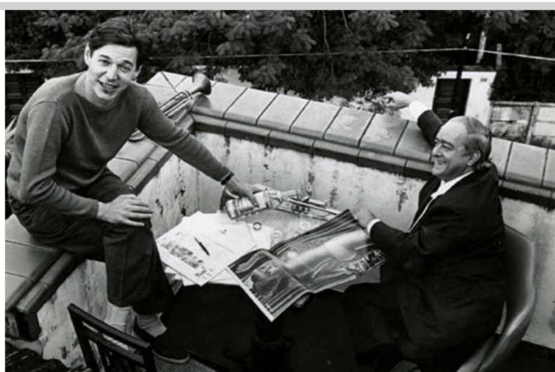
Tom Jobim e Vinícius de Moraes.