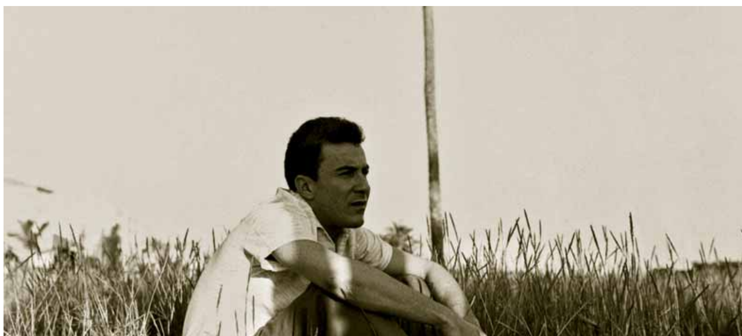
João Gilberto na época da gravação de seu primeiro disco.

Em julho de 1958, meses depois de Canção do Amor Demais chegar às lojas, João Gilberto concluiu a gravação de seu próprio disco 78 rotações , contendo de um lado a canção Chega de Saudade , e de outro, Bim Bom , composição própria. Nesse trabalho autoral, em que definitivamente foi consolidado o que seria chamado de bossa nova, aparece outra faceta de João Gilberto: a forma de cantar o samba.